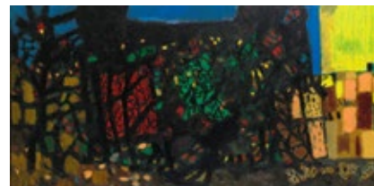
Arnold Bode, Augustbild, 121,5 x 243 cm, 1957/58, Öl auf Leinwand, Museumslandschaft Hessen Kassel, Neue Galerie, Leihgabe des Museumsvereins Kassel e.V.

Die Ausstellung ist eine Kooperation der Museumslandschaft Hessen Kassel, des documenta archivs, der Kunsthochschule Kassel und der Galerie Rasch.