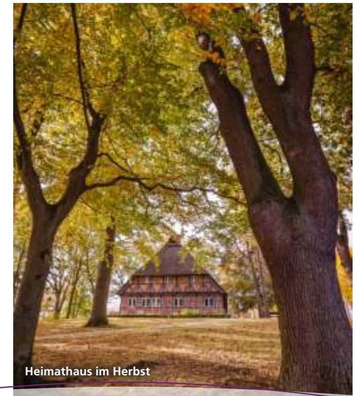
Heimathaus im Herbst

📍 Niedersachsenplatz, 21266 Jesteburg 🌐 www.jesteburg-touristik.de