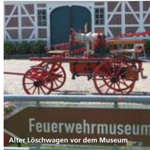
Alter Löschwagen vor dem Museum