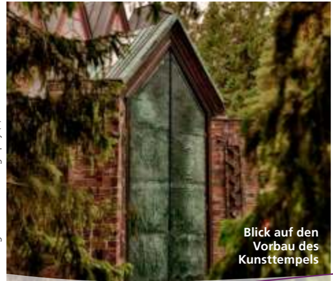
Blick auf den Vorbau des Kunsttempels