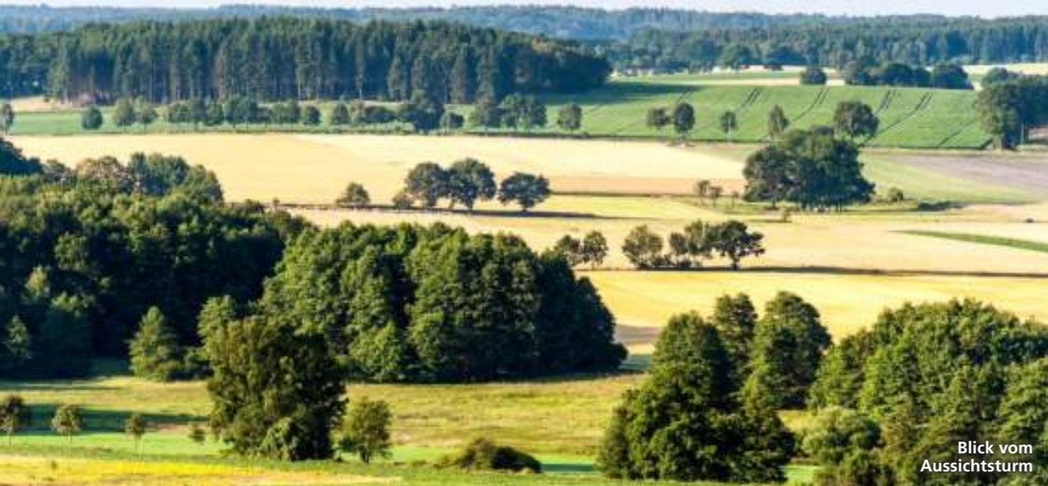
Blick vom Aussichtsturm