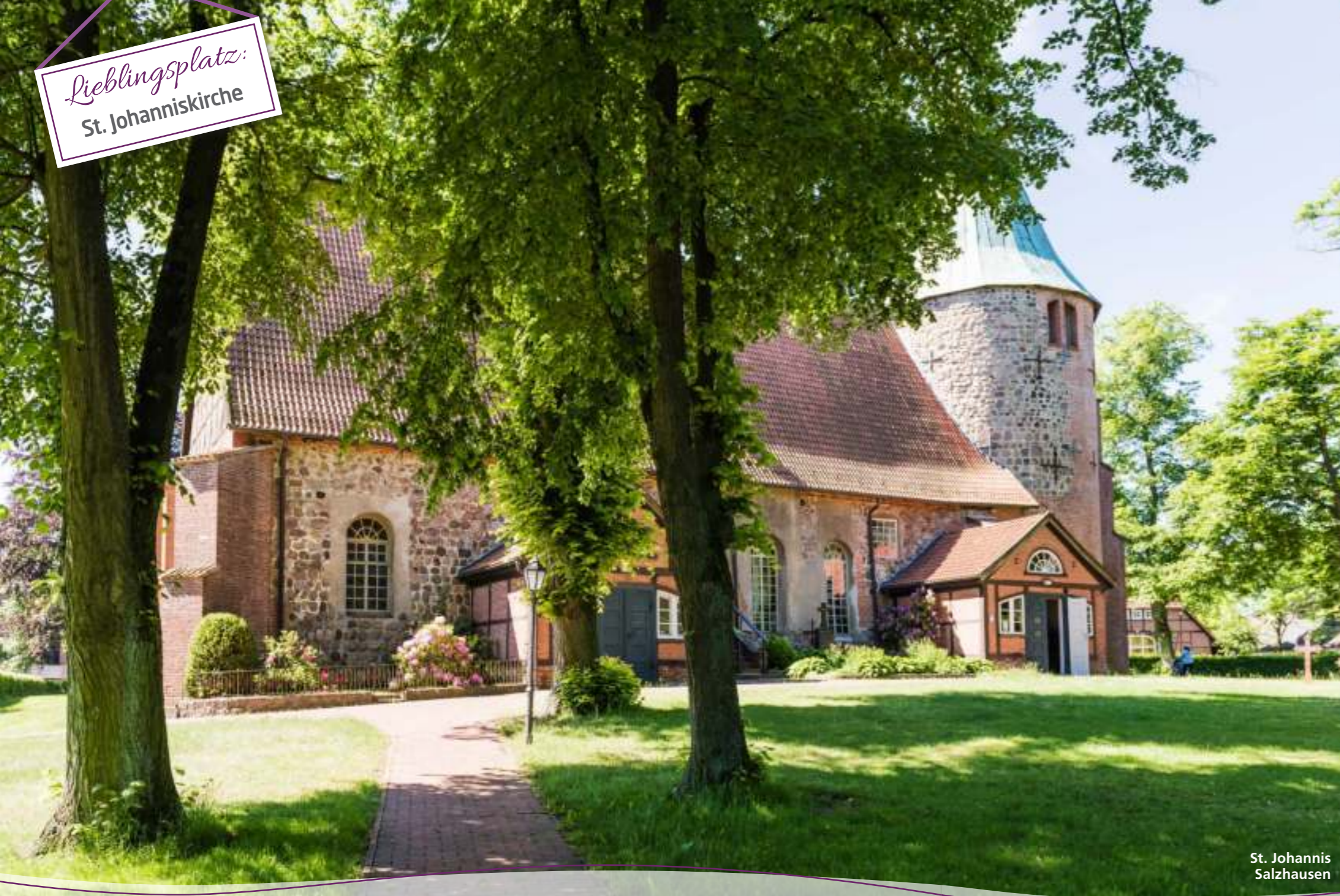
St. Johannis Salzhausen