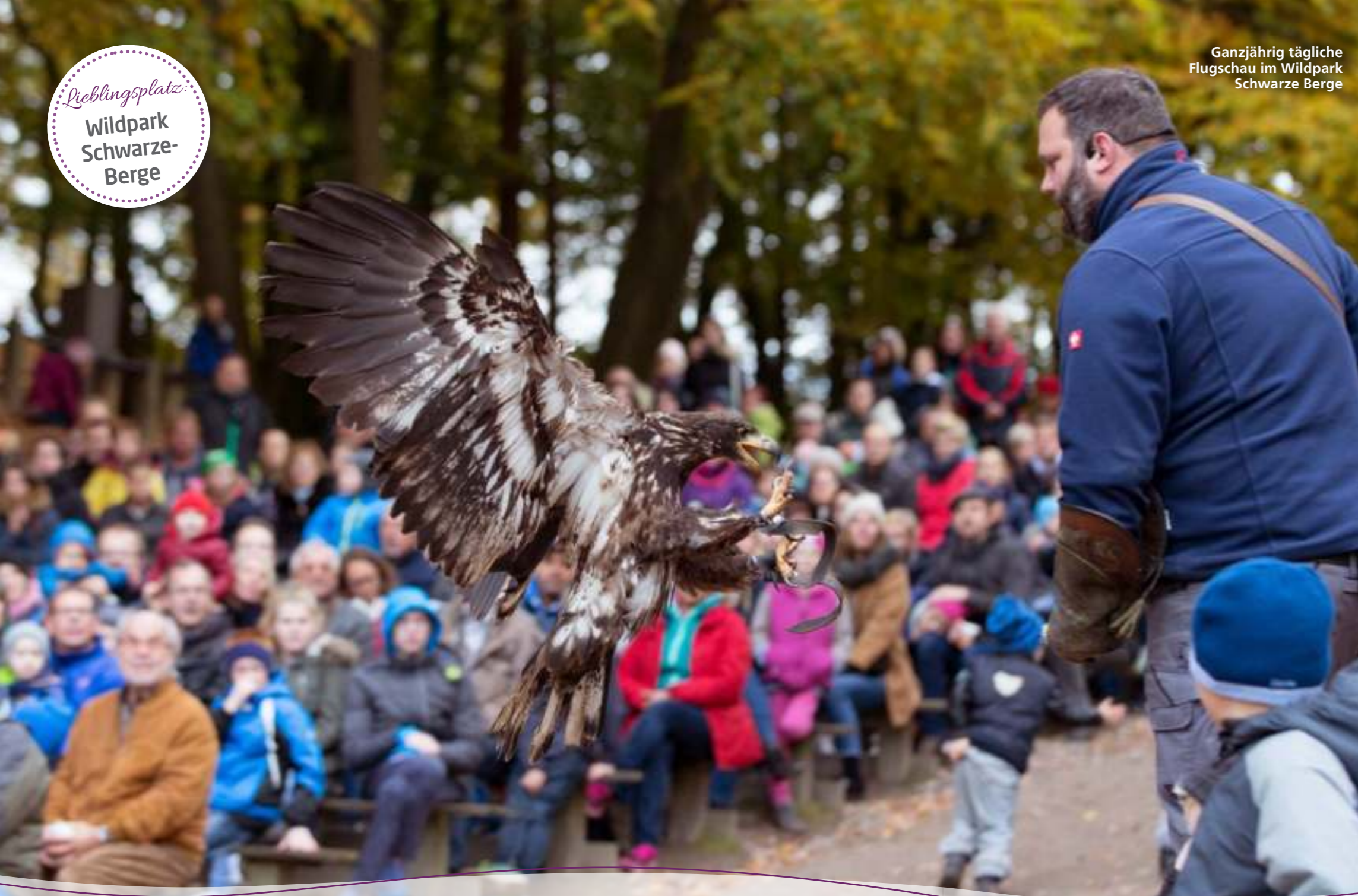
Ganzjährig tägliche Flugschau im Wildpark Schwarze Berge

Lieblingsplatz: Wildpark Schwarze- Berge