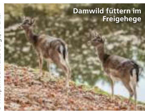
Damwild füttern im Freigehege

„Ich liebe den Wildpark zu jeder Jahreszeit. Im Winter, wenn man das Damwild im Freigehege ganz für sich hat und es vorsichtig aus der Hand frisst, oder an schönen lauen Sommerabenden, wenn sich vom 45 Meter hohen Elbblickturm ein stimmungsvoller Sonnenuntergang über Hamburg zeigt. Mein absolutes Highlight ist die tägliche Flugschau, bei der Adler, Bussard und Co. zum Greifen nah über den Köpfen kreisen.“