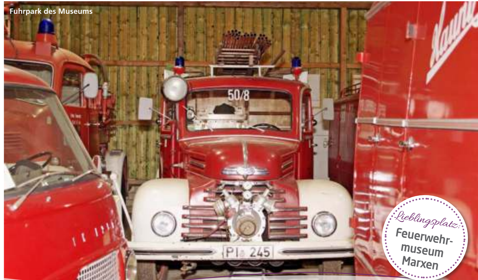
Fuhrpark des Museums

Lieblingsplatz: Feuerwehr- museum Marxen