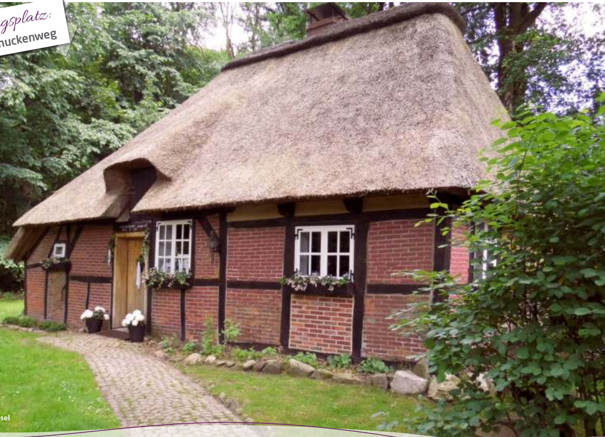
Hexenhaus in Wesel