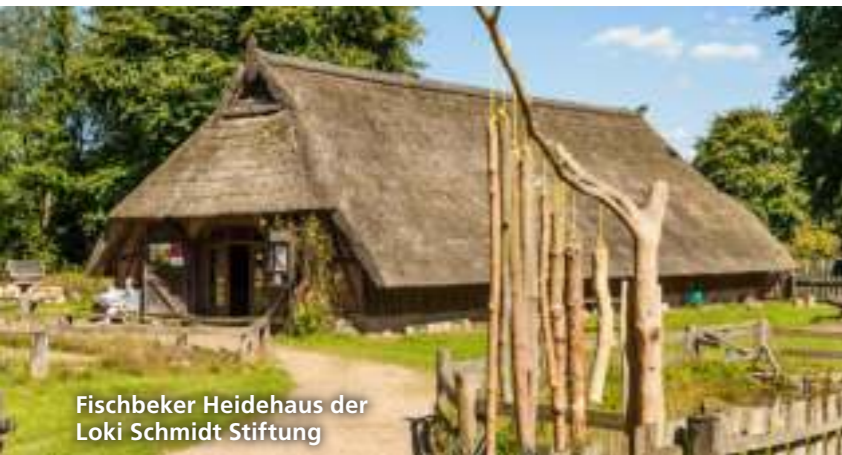
Fischbeker Heidehaus der Loki Schmidt Stiftung