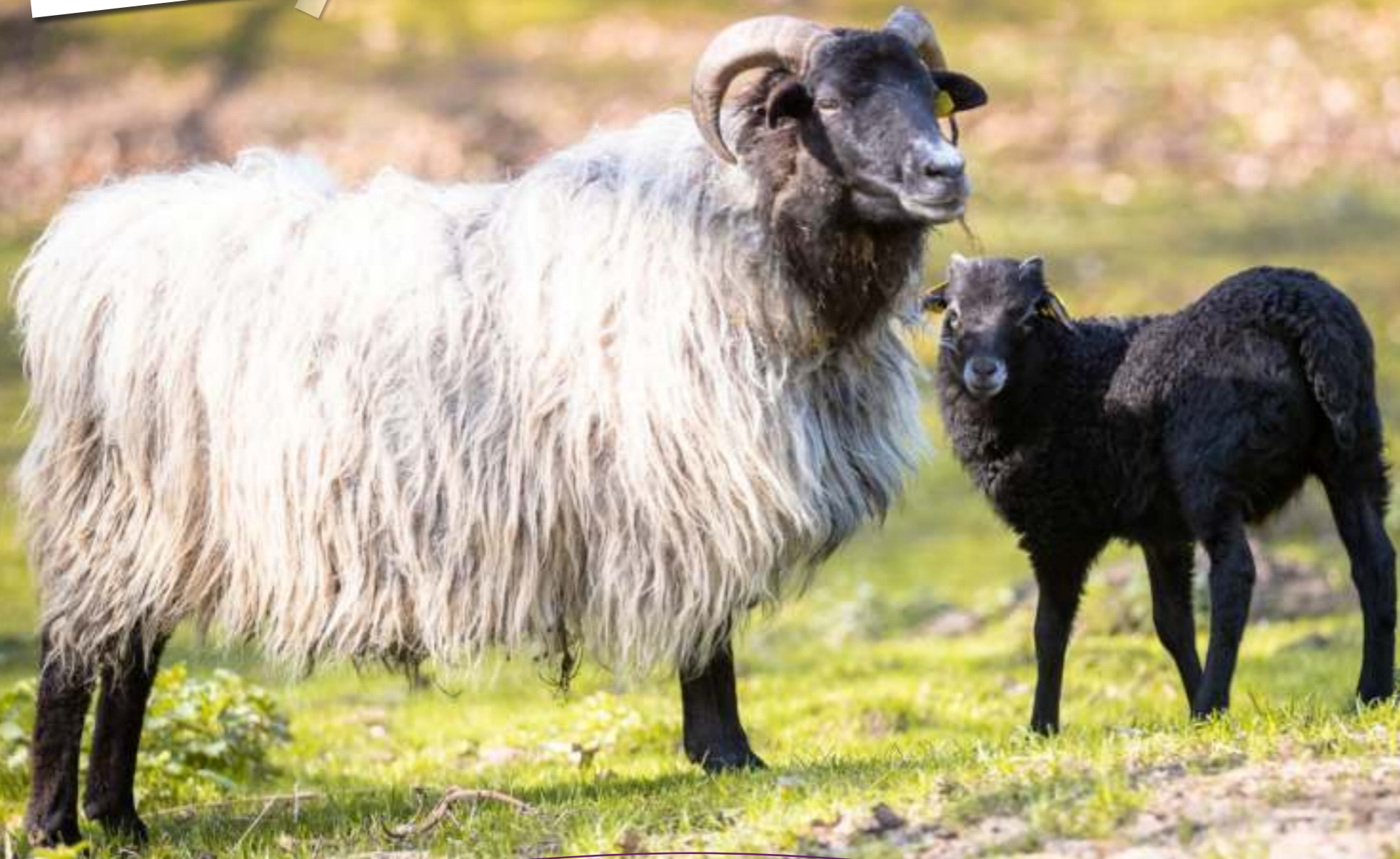
Heidschnucken im Wildpark

Lieblingsplatz: Wildpark Lüneburger Heide