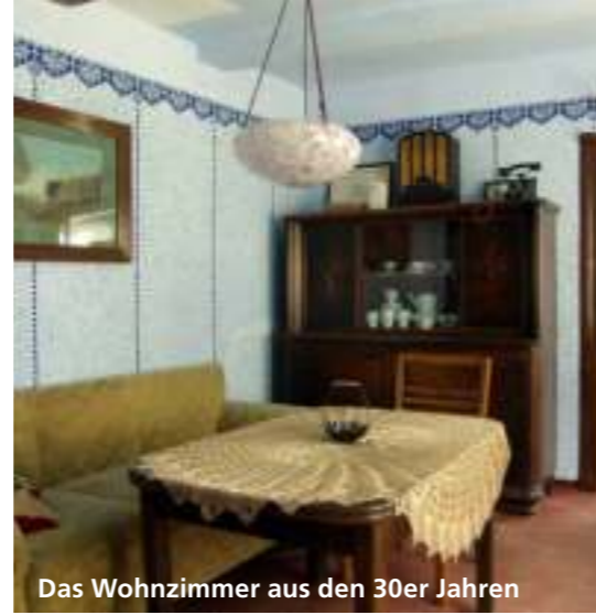
Das Wohnzimmer aus den 30er Jahren

📍 Museumsbauernhof Wennerstorf, Lindenstr. 4, 21279 Wennerstorf bei Rade 🌐 www.museumsbauernhof.de