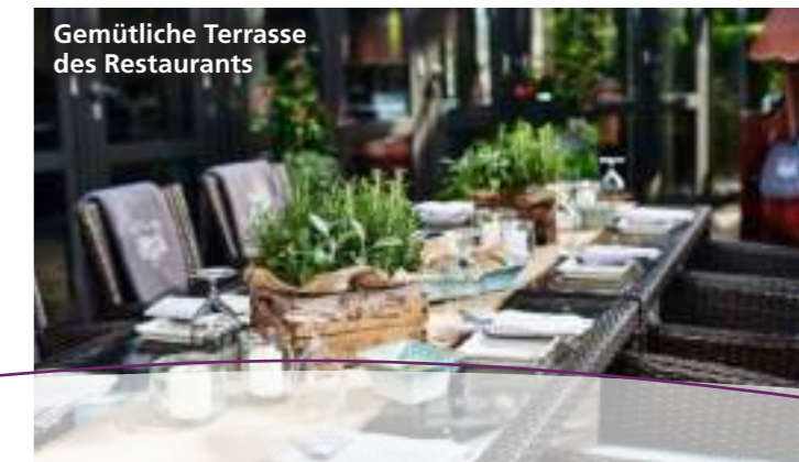
Gemütliche Terrasse des Restaurants