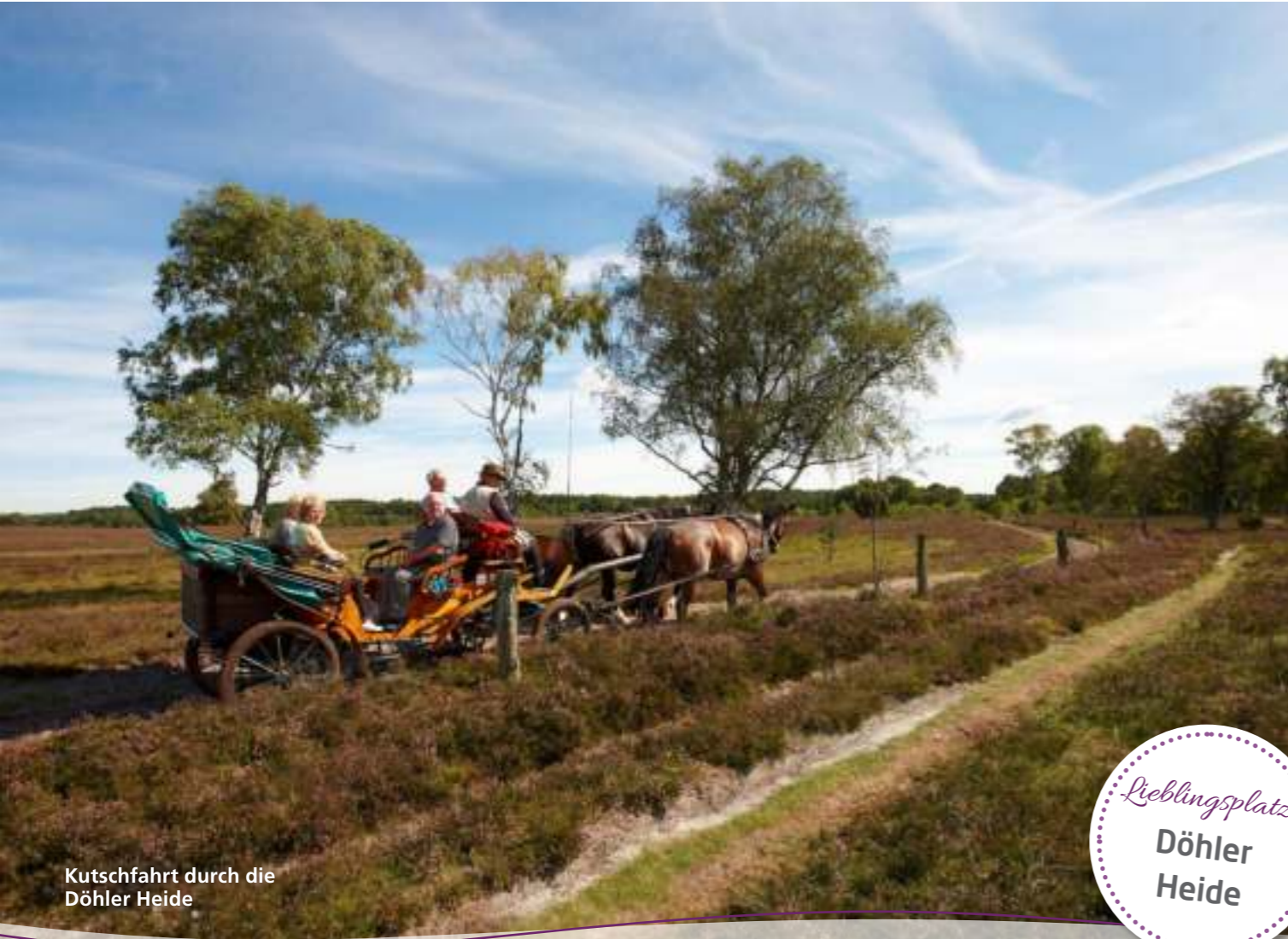
Kutschfahrt durch die Döhler Heide