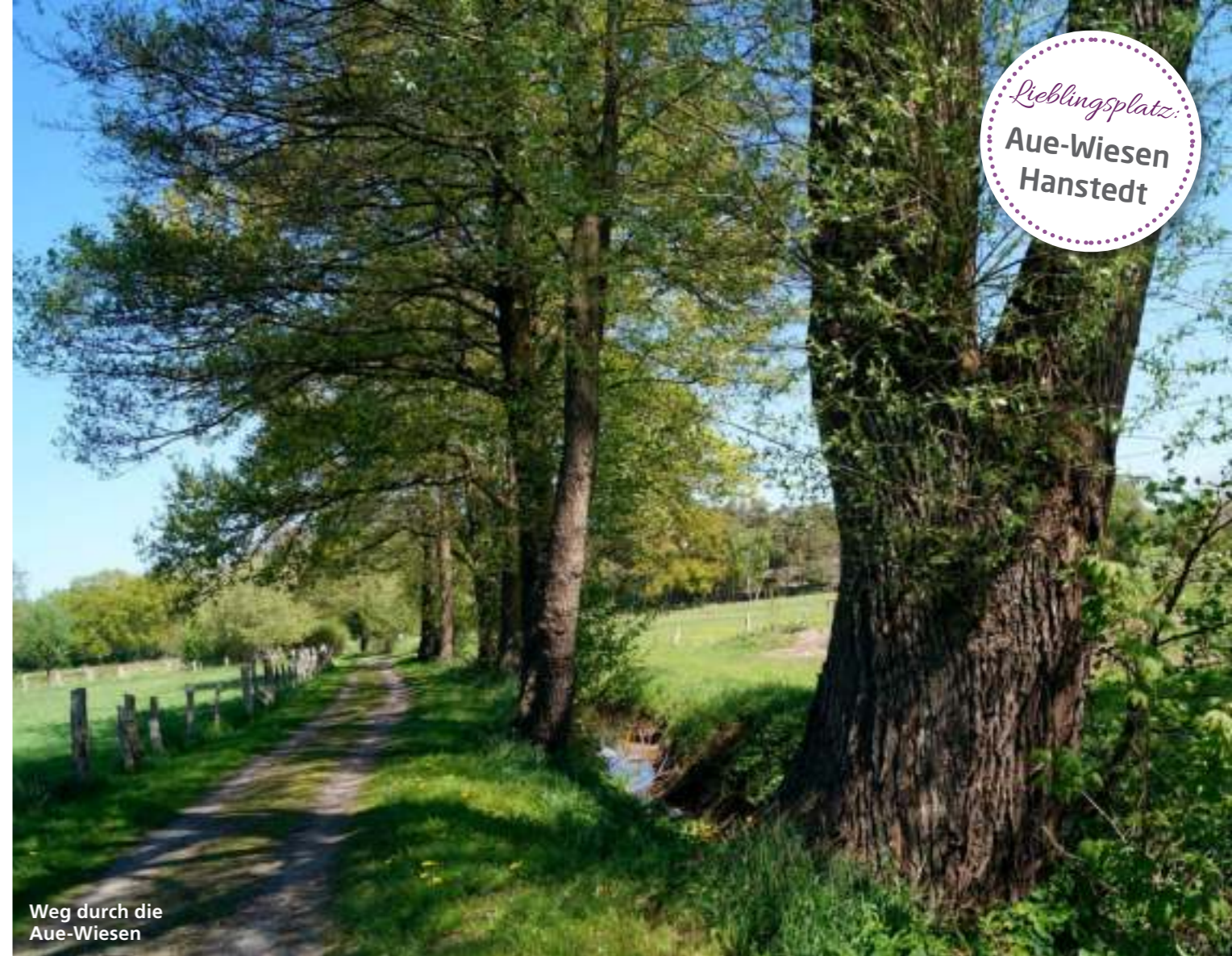
Weg durch die Aue-Wiesen