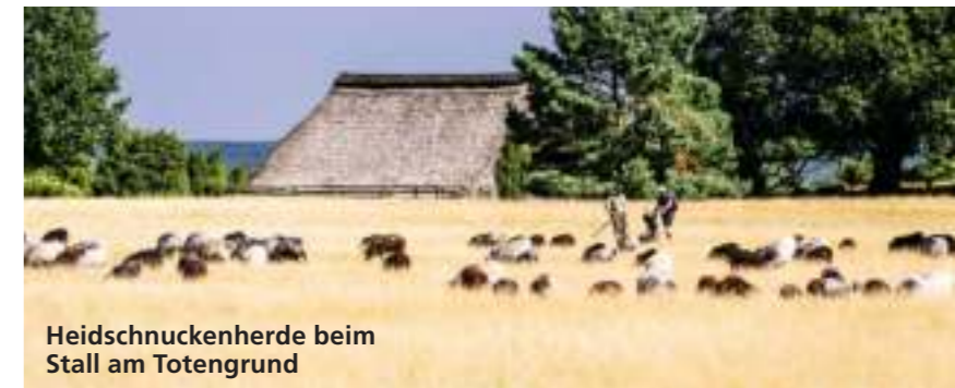
Heidschnuckenherde beim Stall am Totengrund

📍 Parkplatz am Ende der Wilseder Straße, 21274 Undeloh 🌐 www.lueneburger-heide.de/natur/sehenswuerdigkeit