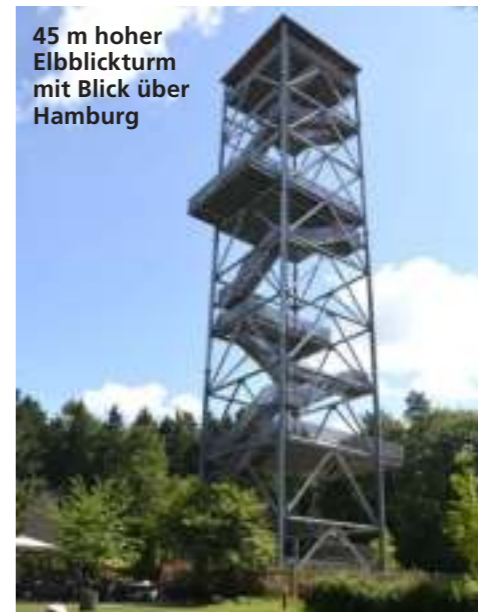
45 m hoher Elbblickturm mit Blick über Hamburg