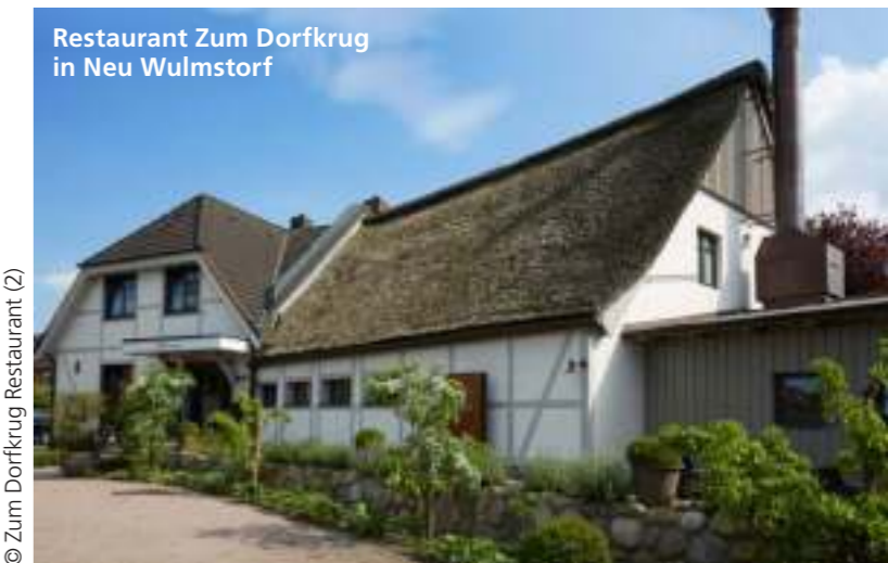
Restaurant Zum Dorfkrug in Neu Wulmstorf

📍 Zum Dorfkrug Restaurant, Grenzweg 1, 21629 Neu Wulmstorf 🌐 www.zum-dorfkrug.de