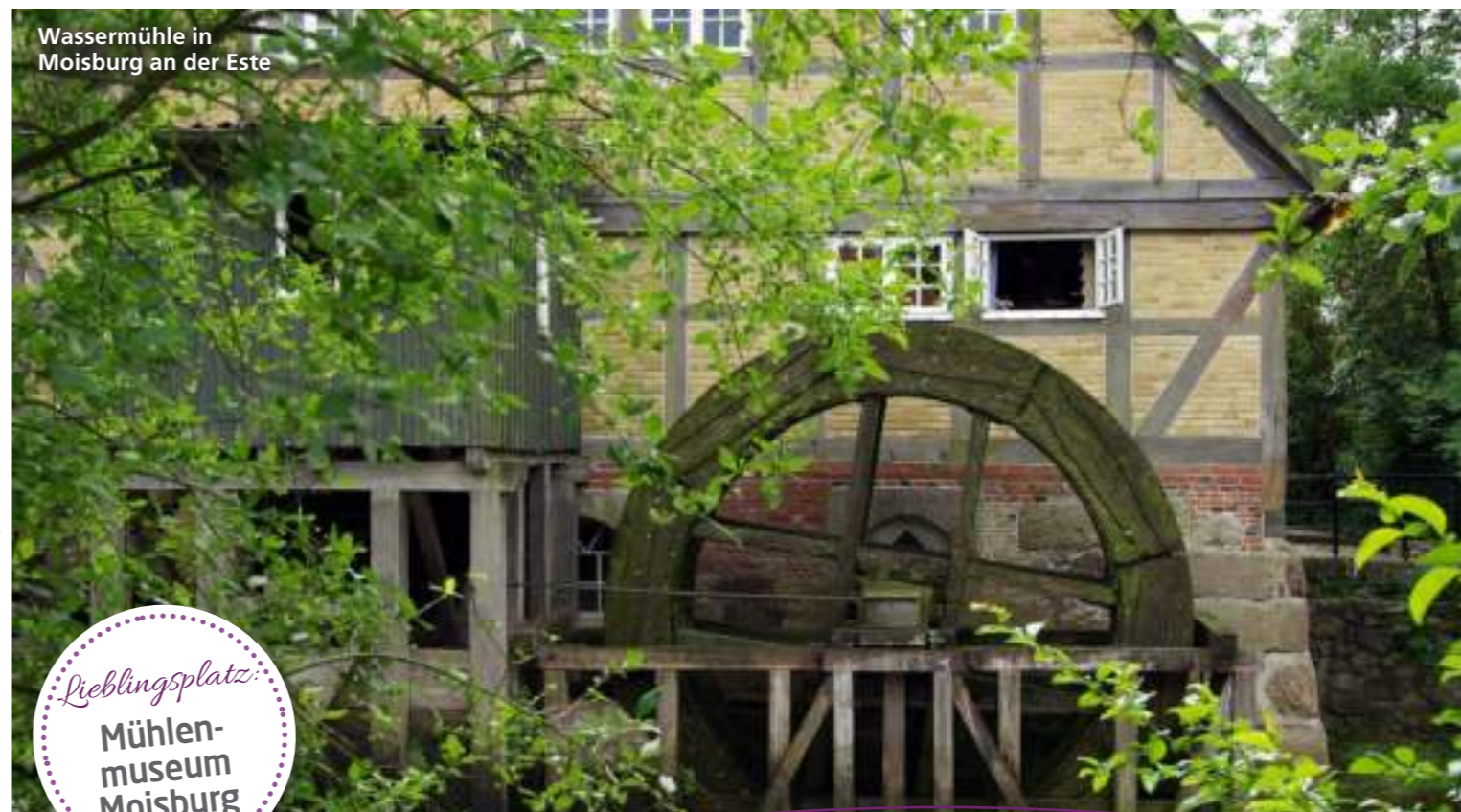
Wassermühle in Moisburg an der Este