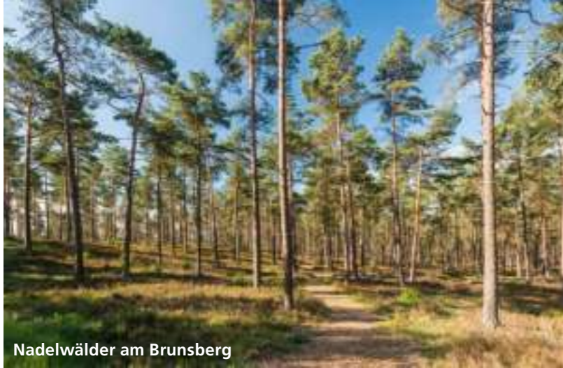
Nadelwälder am Brunsberg