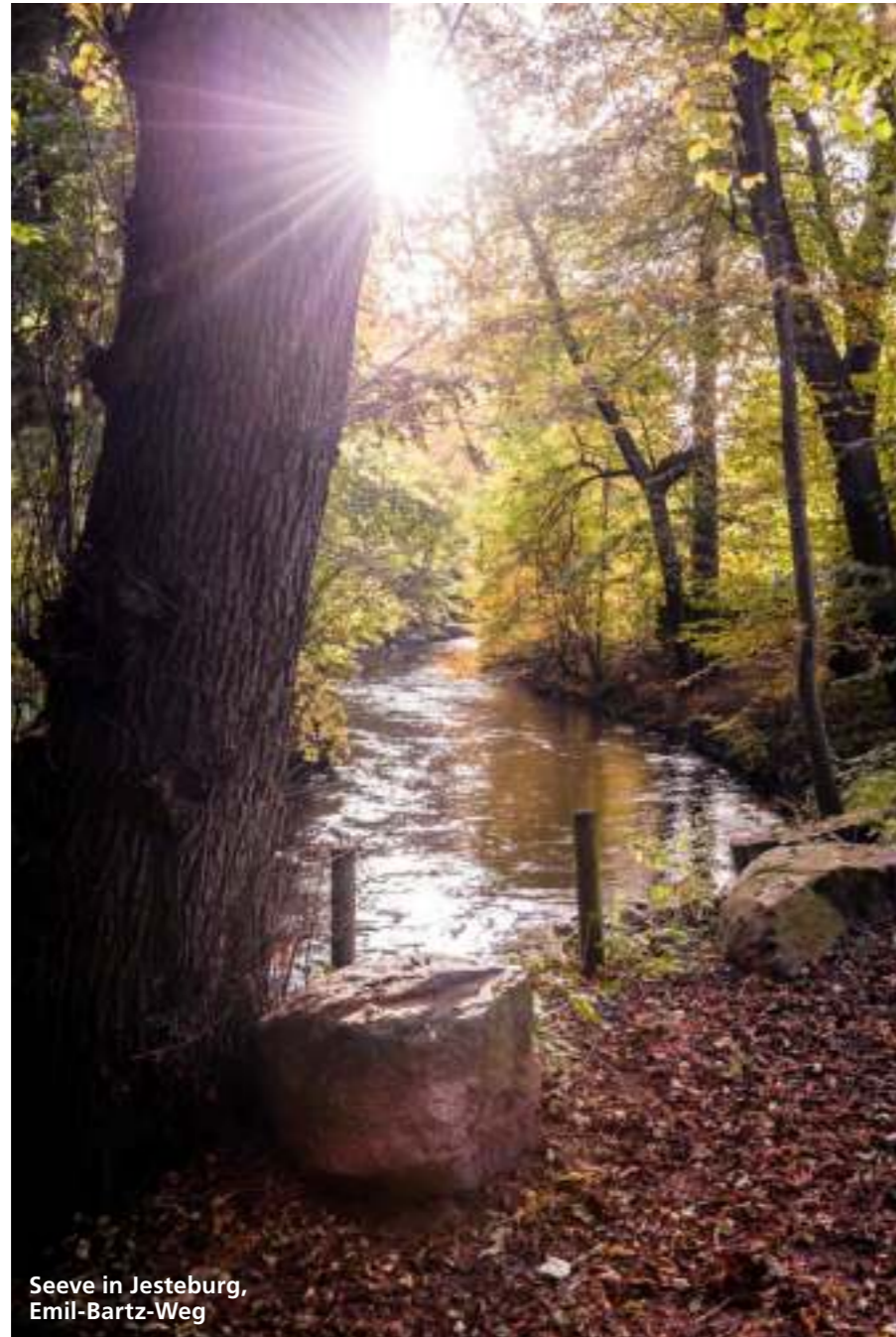
Seeve in Jesteburg, Emil-Bartz-Weg

„Ich bin begeisterter Fahrradfahrer. Eine meiner Lieblingstouren ist der abwechslungs- reiche Seeve-Radweg. Hier tanke ich neue Energie. Ich mag be- sonders den Ring 2, der von Lüllau nach Jesteburg über Ben- destorf bis zur Horster Mühle führt, weil ich auf der 31 km langen Tour der ursprüngli- chen Natur sehr nah bin und es immer wie- der etwas Neues zu entdecken gibt.“