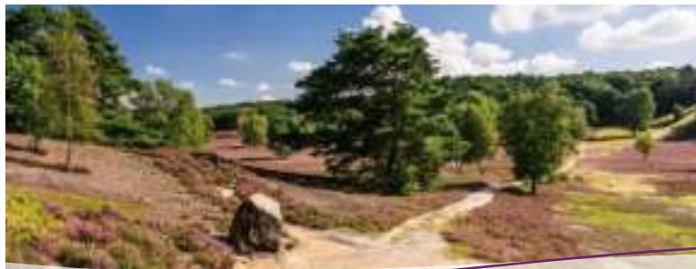
Weg durch die Fischbeker Heide