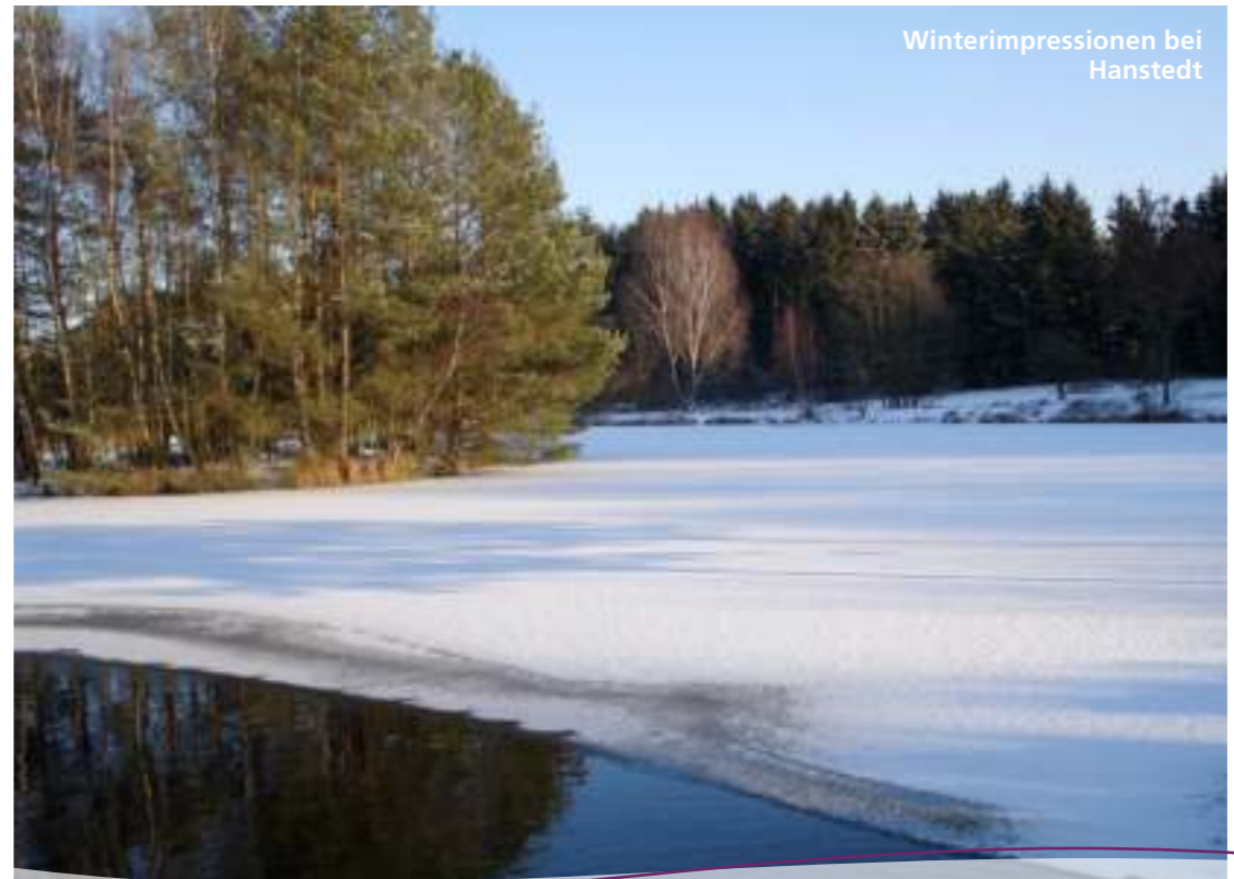
Winterimpressionen bei Hanstedt