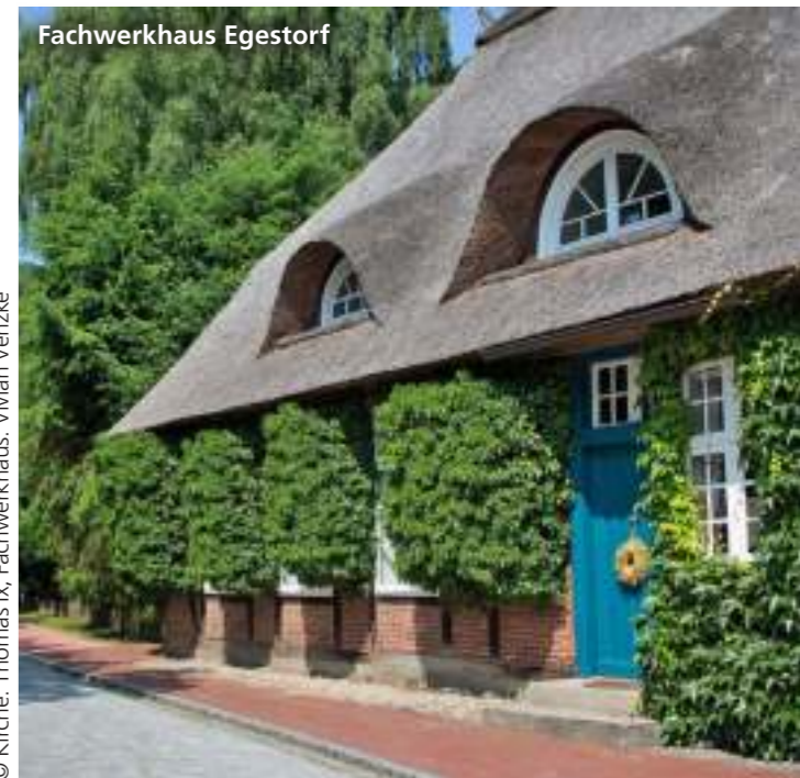
© Kirche: Thomas Ix, Fachwerkhaus: Vivian Venzke