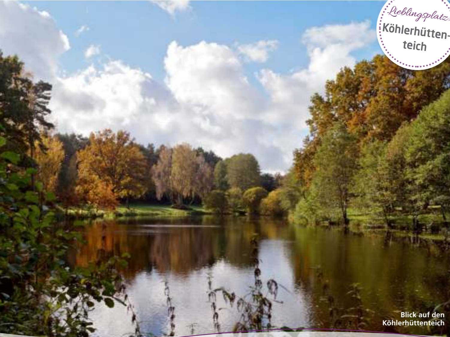
Blick auf den Köhlerhütten- teich