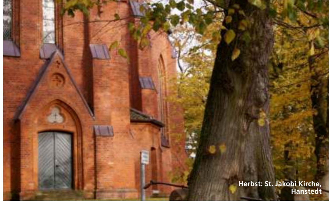
Herbst: St. Jakobi Kirche, Hanstedt