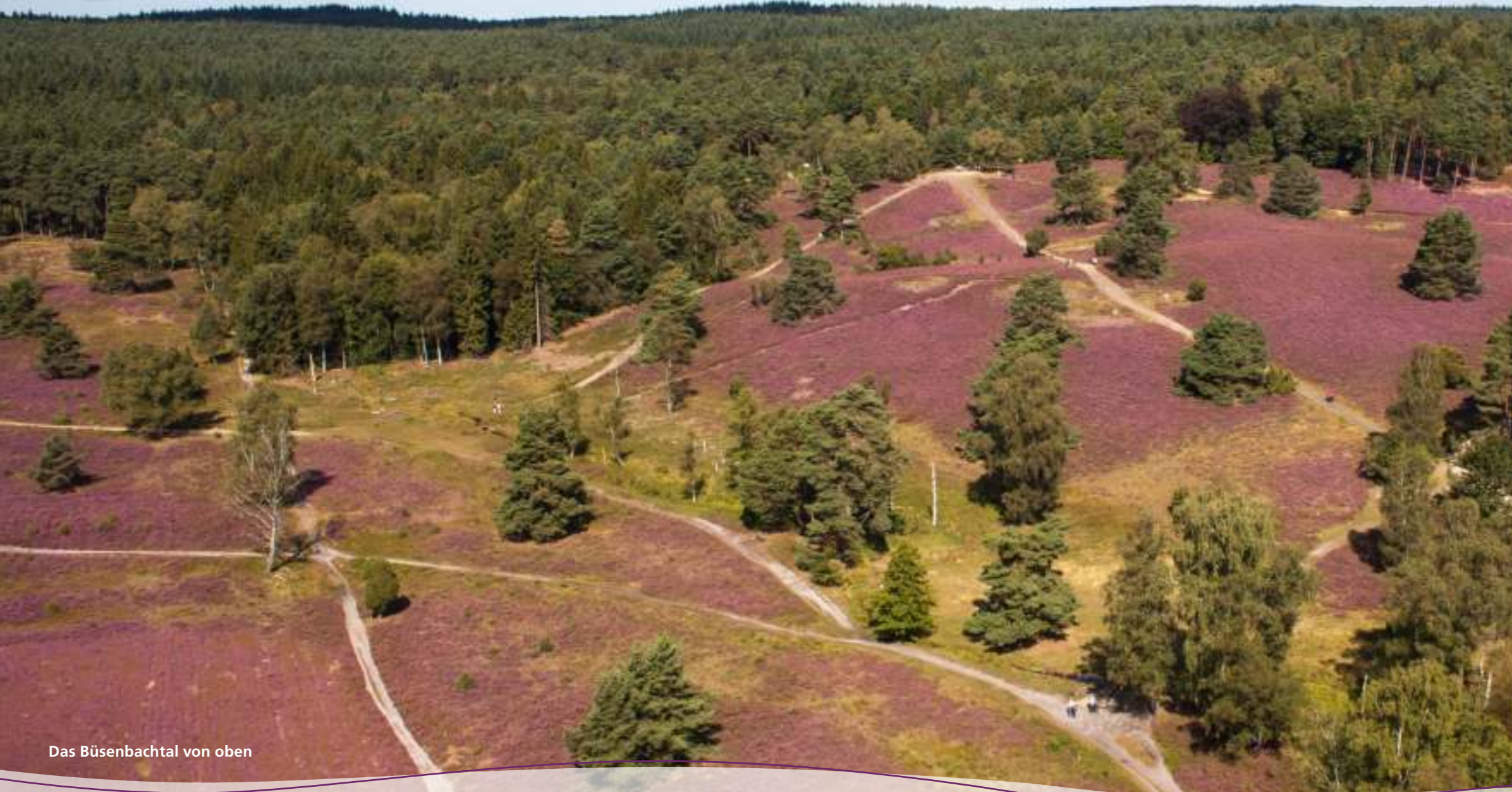
Das Büsenbachtal von oben