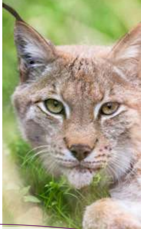
Luchs im Wildpark

📍 Wildpark 1, 21271 Nindorf-Hanstedt 🌐 www.wild-park.de