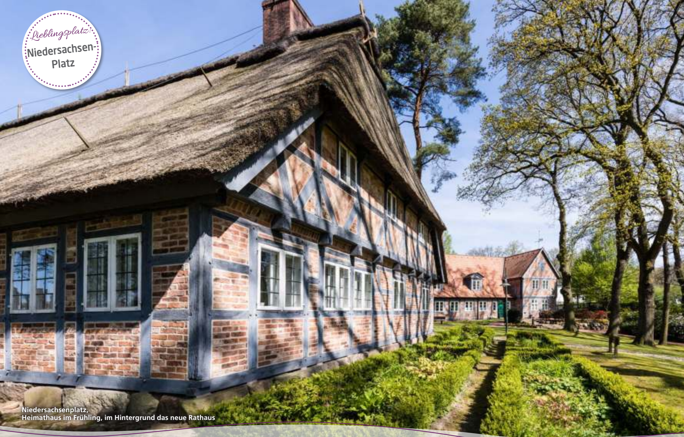
Niedersachsenplatz, Heimathaus im Frühling, im Hintergrund das neue Rathaus