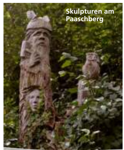
Skulpturen am Paaschberg