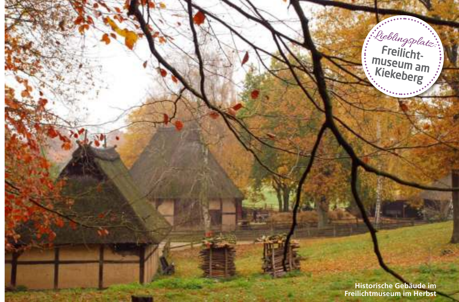
Historische Gebäude im Freilichtmuseum im Herbst

Lieblingsplatz: Freilicht- museum am Kiekeberg