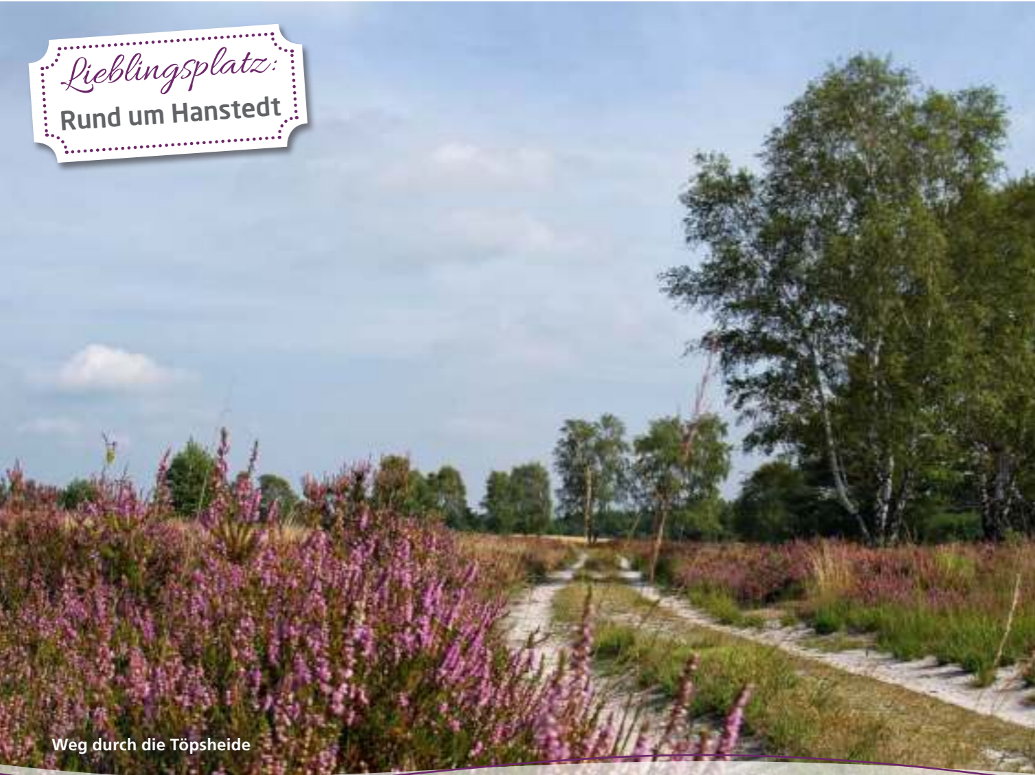
Weg durch die Töpsheide