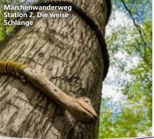
Märchenwanderweg Station 2, Die weise Schlange