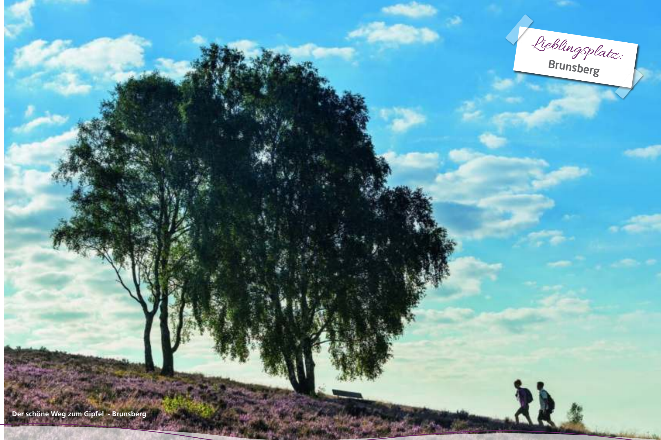
Der schöne Weg zum Gipfel - Brunsberg