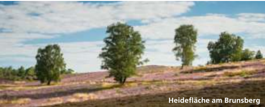
Heidefläche am Brunsberg