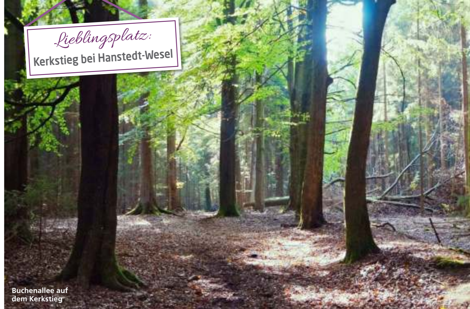
Buchenallee auf dem Kerkstieg

Lieblingsplatz: Kerkstieg bei Hanstedt-Wesel