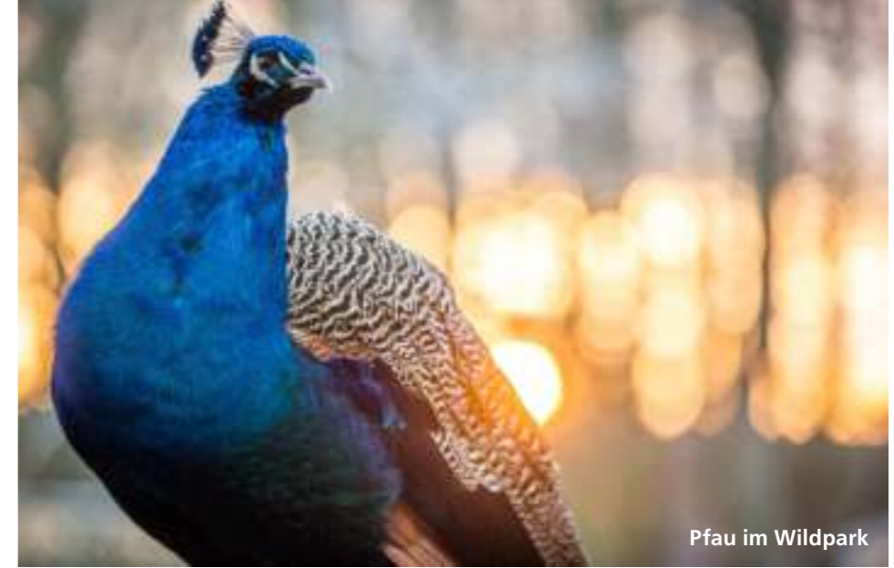
Pfau im Wildpark