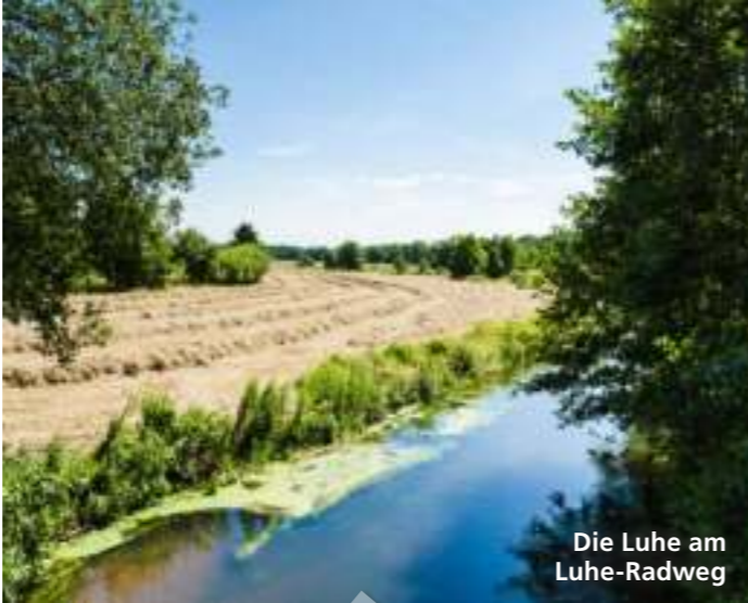
Die Luhe am Luhe-Radweg

📍 Start in Salzhausen: St Johanniskirche, Hauptstraße 3a 🌐 www.lueneburger-heide.de/service/tour/4500/luhe-radweg.html