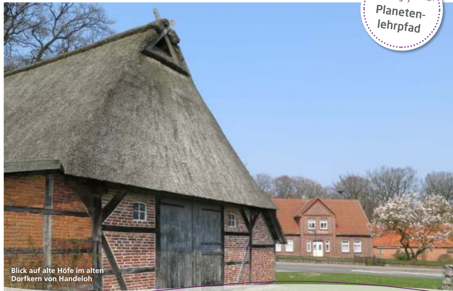
Blick auf alte Höfe im alten Dorfkern von Handeloh

📍 Im Dorfe 20, 21256 Handeloh 🌐 www.hofgemeinschaftwoerme.de