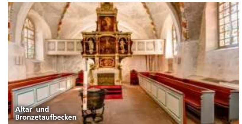
Altar und Bronzetaufbecken