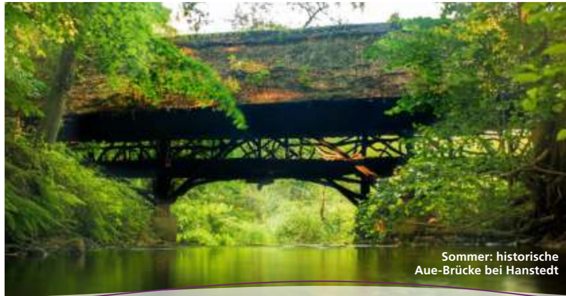
Sommer: historische Aue-Brücke bei Hanstedt