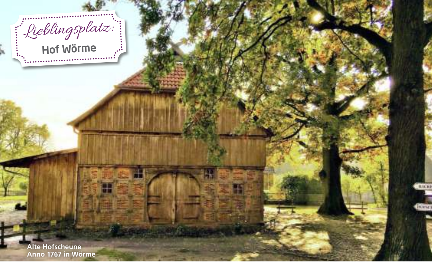
Alte Hofscheune Anno 1767 in Wörme