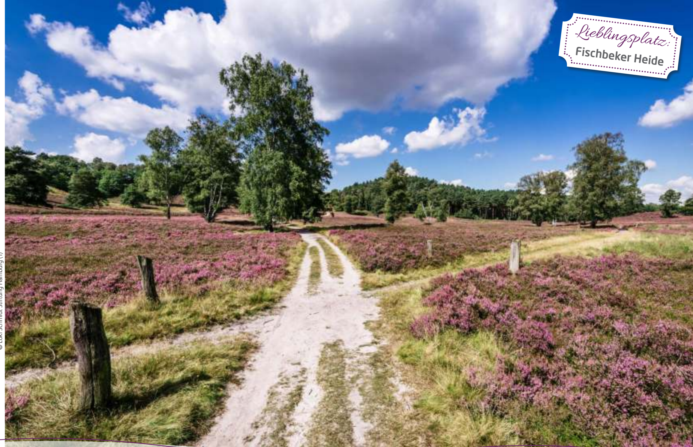
Fischbeker Heide zur Heideblüte