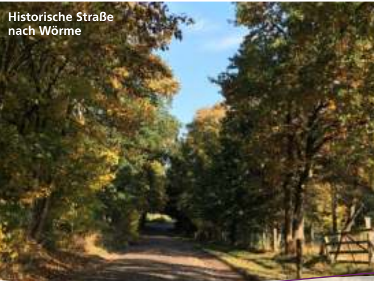
Historische Straße nach Wörme

📍 Hauptstraße 2, 21256 Handeloh 🌐 www.astronomie-handeloh.de