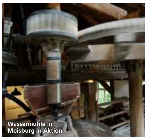
Wassermühle in Moisburg in Aktion

📍 Auf dem Damm 10, 21647 Moisburg 🌐 www.muehlenmuseum-moisburg.de