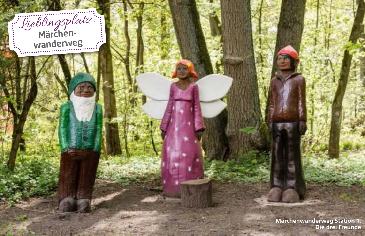
Märchenwanderweg Station 1, Die drei Freunde