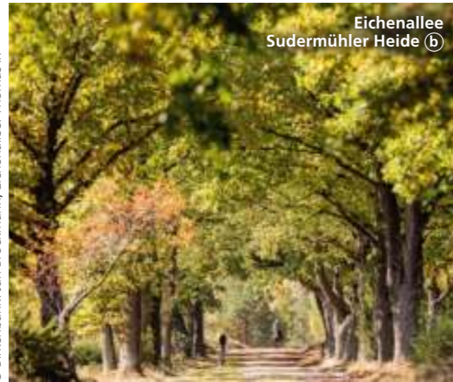
Eichenallee Sudermühler Heide b