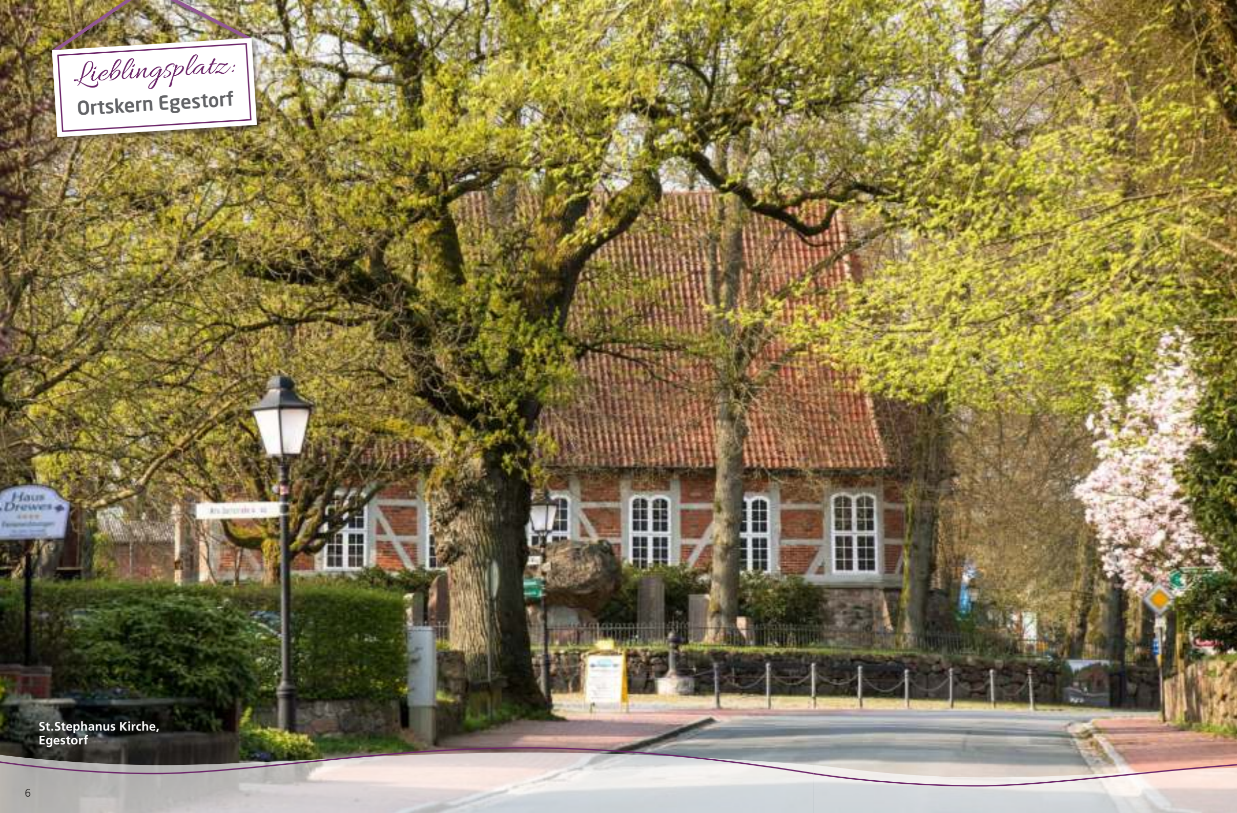
St. Stephanus Kirche, Egestorf