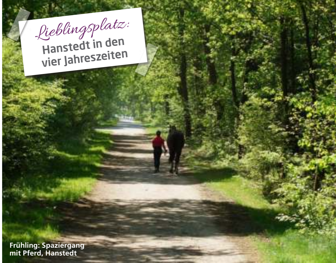
Frühling: Spaziergang mit Pferd, Hanstedt

Lieblingsplatz: Hanstedt in den vier Jahreszeiten