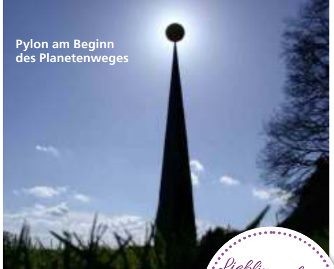
Pylon am Beginn des Planetenweges