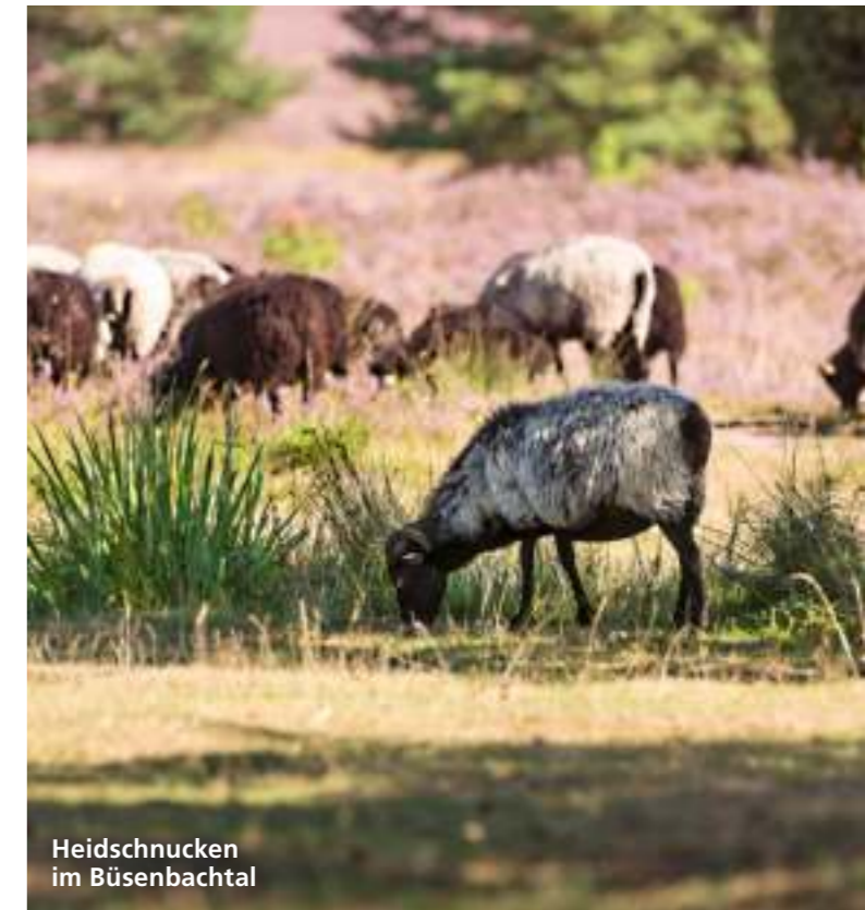
Heidschnucken im Büsenbachtal