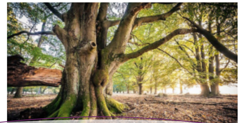
Hutewald bei Wilsede