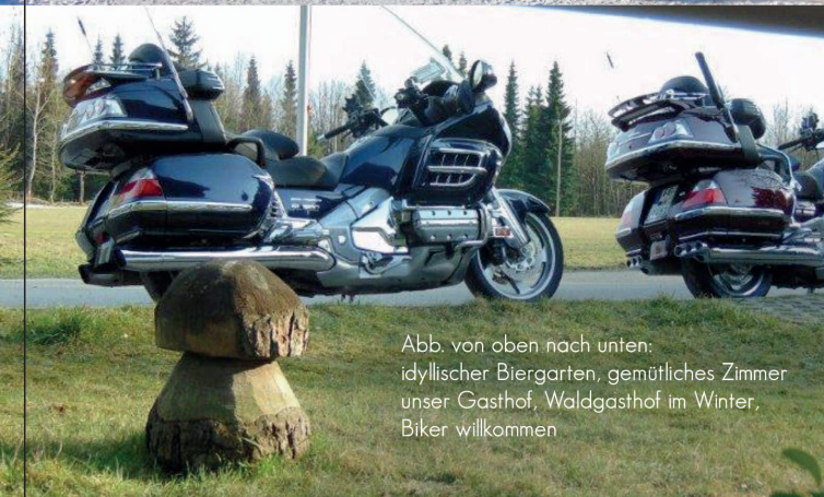
Abb. von oben nach unten: idyllischer Biergarten, gemütliches Zimmer unser Gasthof, Waldgasthof im Winter, Biker willkommen