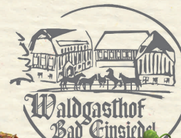
Abb. v.o.n.u.: Unser schöner Waldgasthof, hist. Postkutsche, rustikaler Gasthof, unser Pferdegespann, leckeres Buffet, traumhafte Hochzeitskutsche