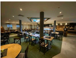
Restaurant / Frühstücksraum