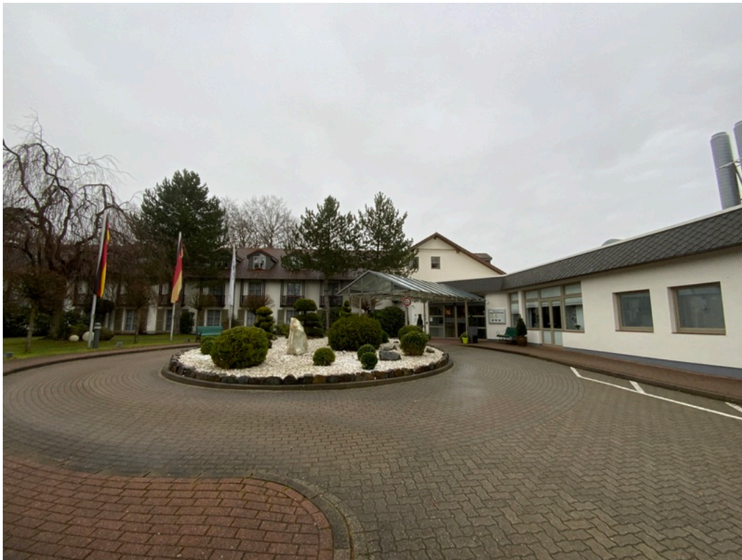
Landhotel Schnuck