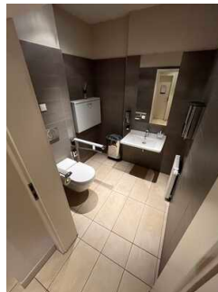
Öffentliches WC im Kloster Kaffee