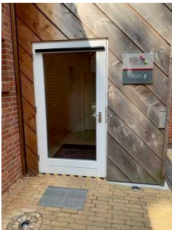
Eingang Haus 2