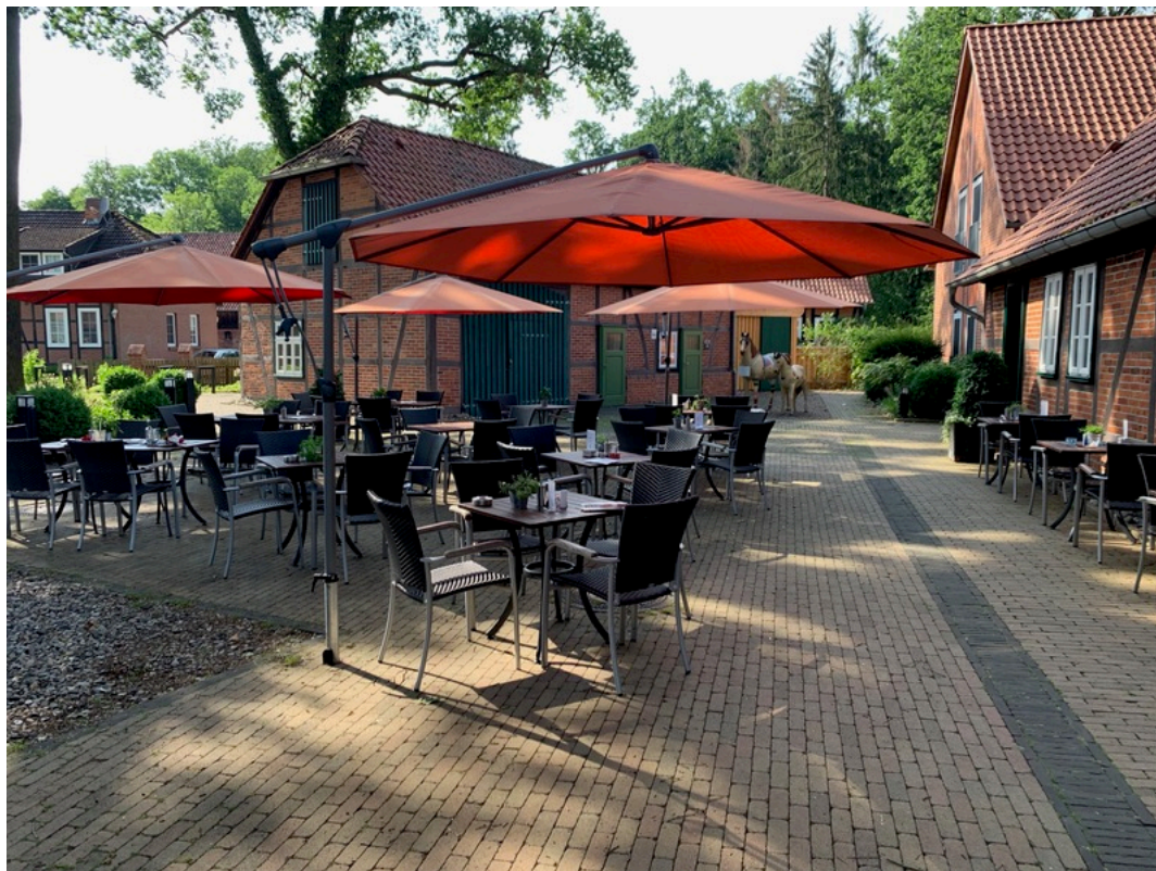
Hotel Am Kloster Wienhausen | ©Guido Frank