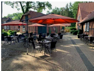
Hotel Am Kloster Wienhausen