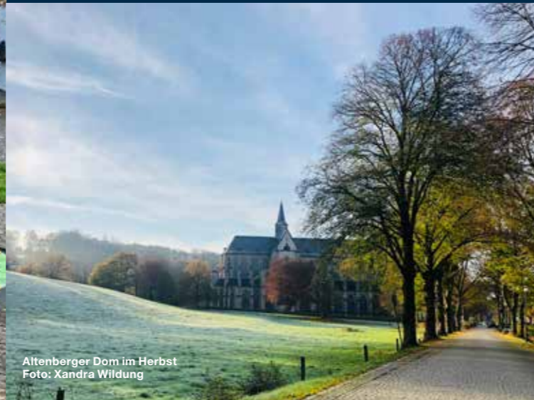
Altenberger Dom im Herbst

Cisterscapes - Europäisches Kulturerbe-Siegel Klosterlandschaft Altenberg Xandra Wildung | Projektleitung Altenberger-Dom-Str. 31 | 51519 Odenthal Tel: 0 22 02 71 01 36 | xandra.wildung@rbk-online.de www.odenthal-altenberg.de/kultur/cisterscapes www.cisterscapes.eu