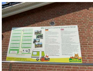
Wildpark–Camping Schwarze Berge