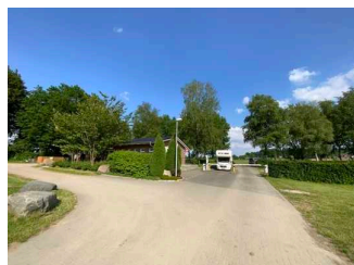
Wildpark–Camping Schwarze Berge