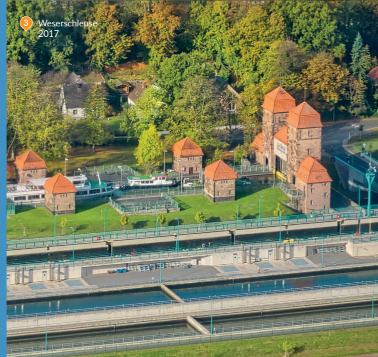
3 Weserschleuse 2017