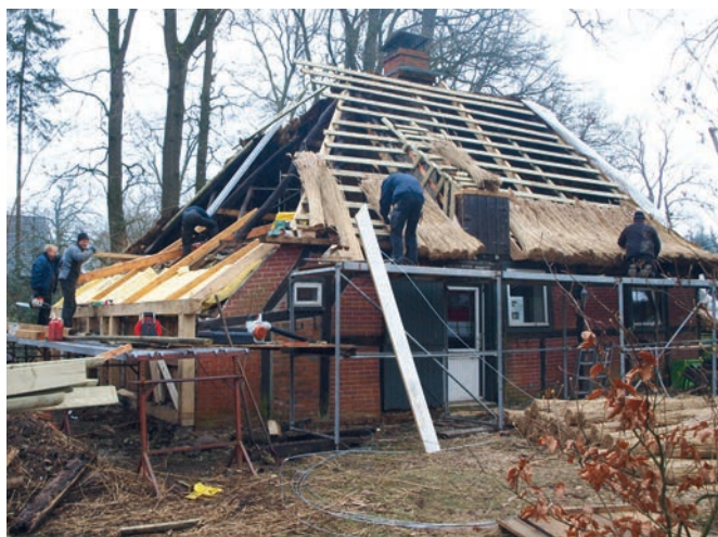
Ein neues Reetdach für das Hexenhaus