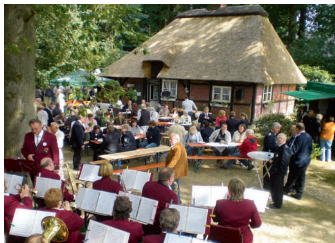
Dorffest am Hexenhaus