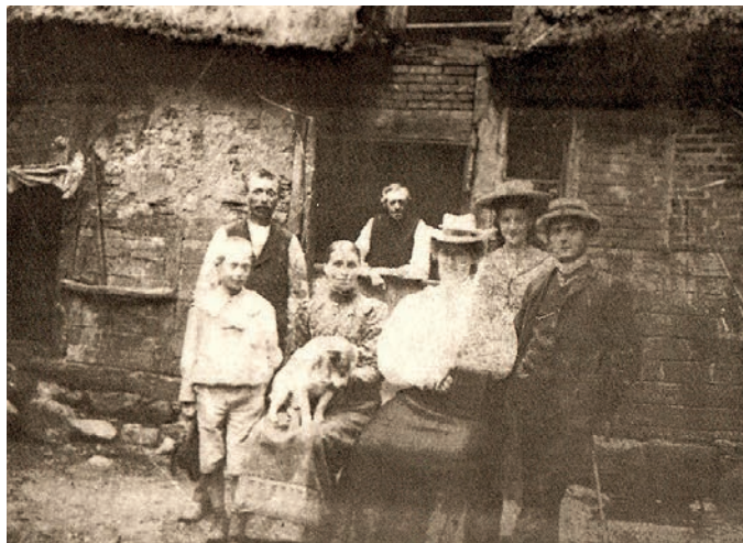
Die ersten Touristen aus der Stadt

Der Name beruht auf der hexenhausartigen verwinkelten Bauweise. Die Bezeichnung des Standortes „Höllenhoff“ weist auf die zahlreichen Stechpalmensträucher im umgebenden Eichenwald hin (von „Hülse“ oder „Holler“ für Ilex. Engl. „Holly“).