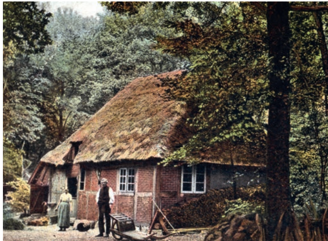
Postkartenmotiv ca. 1898

Das Hexenhaus ist ein ausdrucksvoller Zeuge örtlicher Wirtschafts- und Wohnverhältnisse der vergangenen drei Jahrhunderte. Es wird von der Landesdenkmalbehörde als schützenswertes Einzeldenkmal geführt.