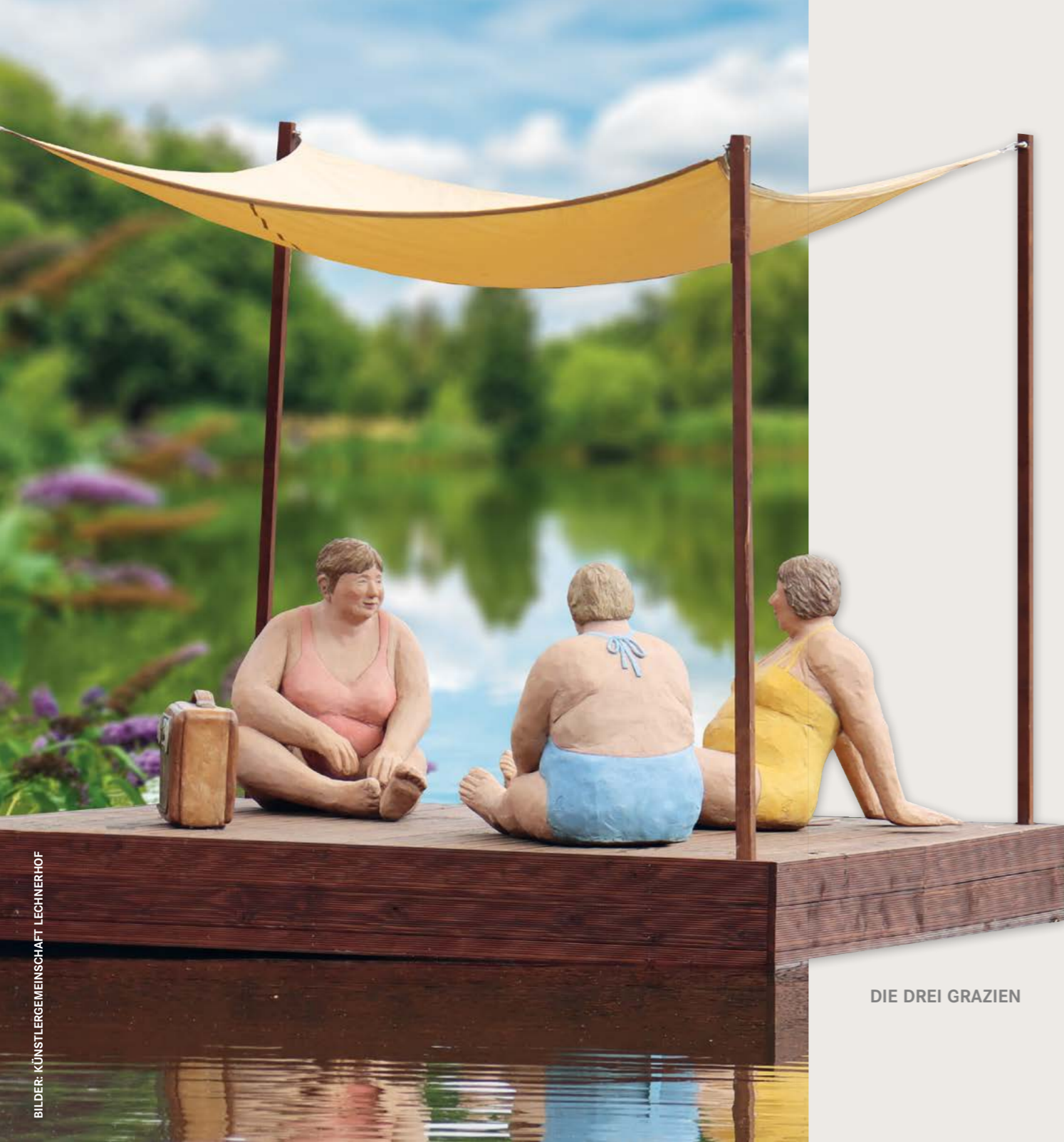
DIE DREI GRAZIEN