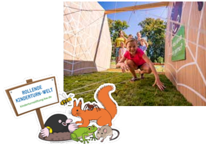
Idee, Satz und Hemusgeber: Baiersbronn Touristik / Max Günter, Rückseite: Heiko Potthoff