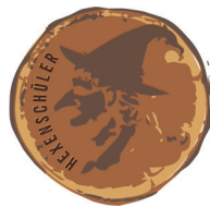
HEXENSCHÜLER 50 Hexen-Goldstücke