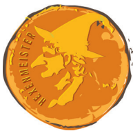
HEXENMEISTER 150 Hexen-Goldstücke

Unsere kleinen und grossen Gäste können am Schalter von Blatten-Belalp Tourismus in Blatten, im World Nature Forum in Naters oder bei ihrem Hotelier einen Hexenpass beziehen. Mit dem Hexenpass können die verteilten Hexengoldstücke auf verschiedenen Wanderzielen auf dem ganzen Gebiet von Blatten-Belalp gesammelt werden, indem der Hexenpass abgeknipst wird. Je nach Länge der Wanderung wird eine bestimmte Anzahl der Goldstücke zu finden sein. Beim Erreichen der angegebenen Goldstücke werden folgende Auszeichnungen vergeben: