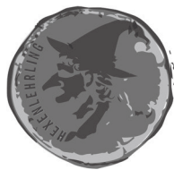
HEXENLEHRLING 80 Hexen-Goldstücke