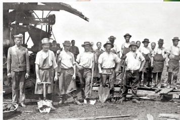
Torfabbau in alten Zeiten