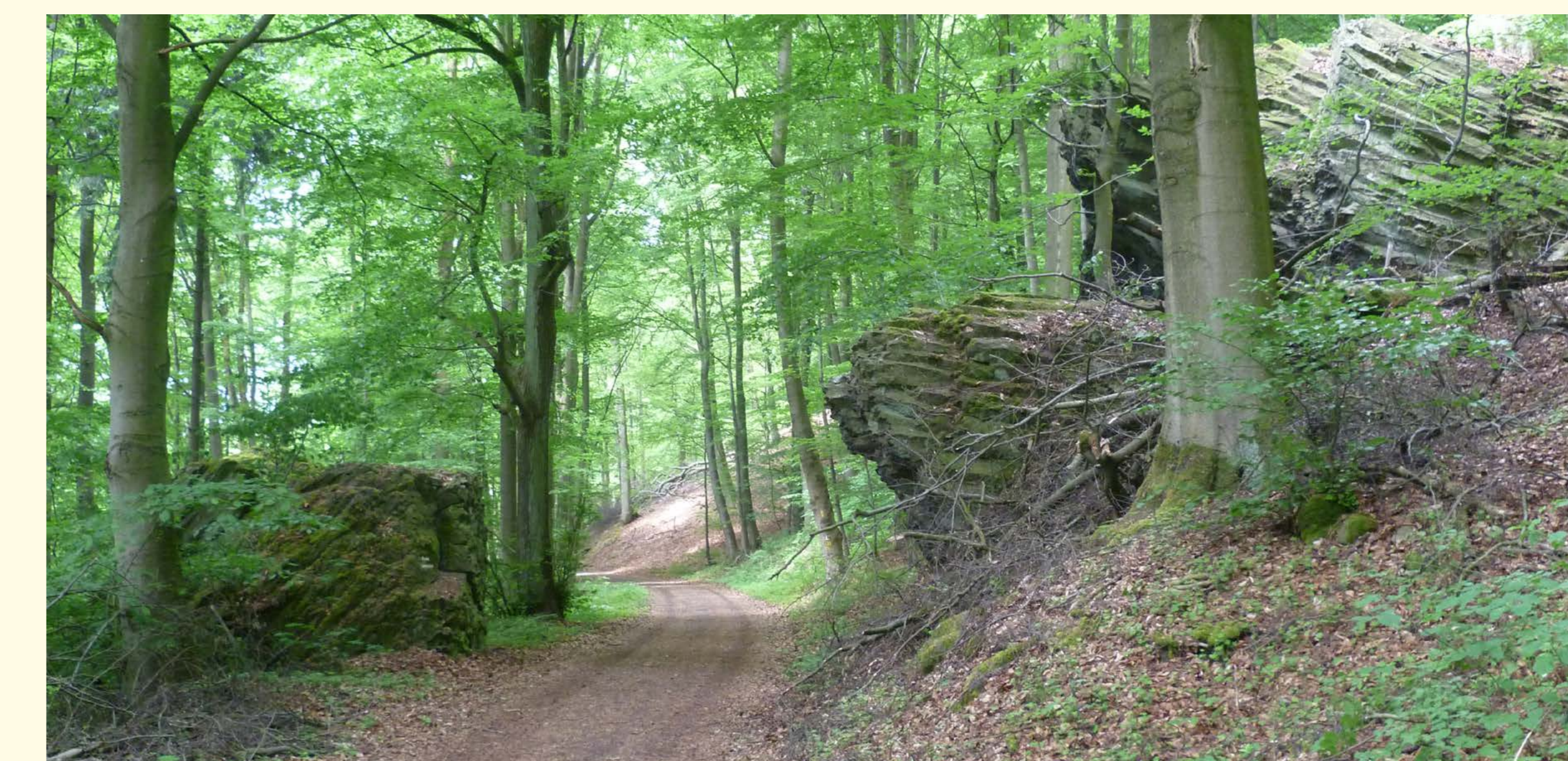
Porta Lapidaria

Kurz vor dem Wanderparkplatz passieren beide Wanderwege das „Steinerne Schweinchen“. Es handelt sich hierbei um einen Stein, der an den Körper eines Schweines erinnert und namensgebend war für die nahegelegene Gastronomie.