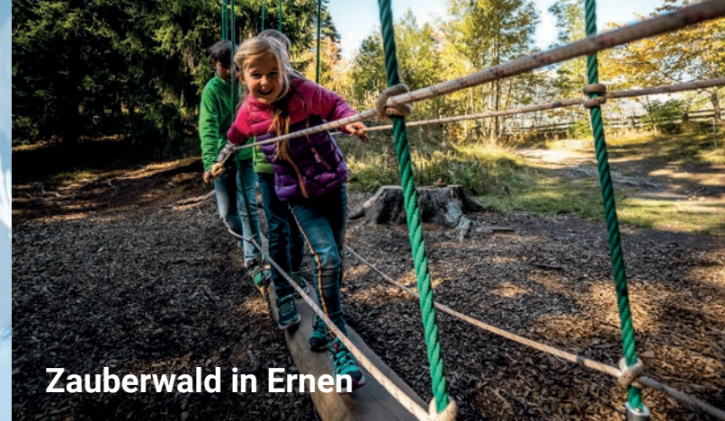
Zauberwald in Ernen