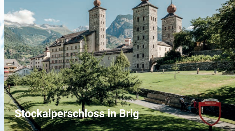
Stockalperschloss in Brig