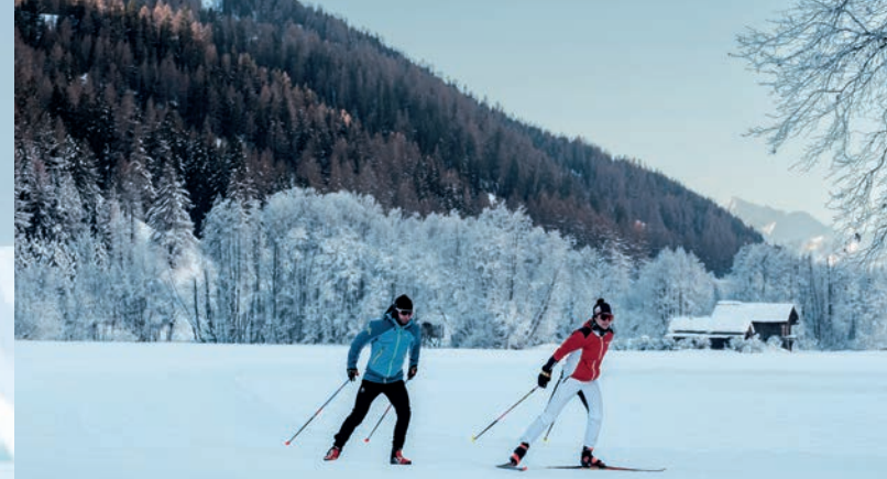
Langlauf im Goms