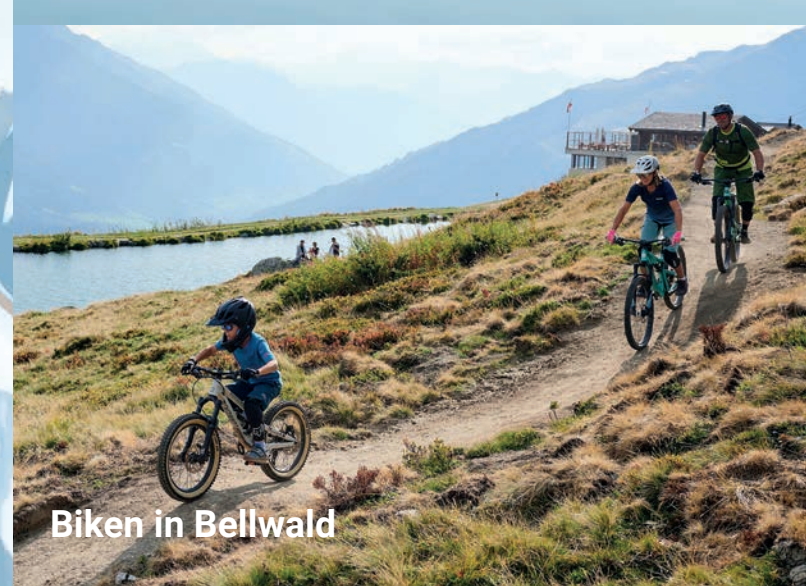
Biken in Bellwald