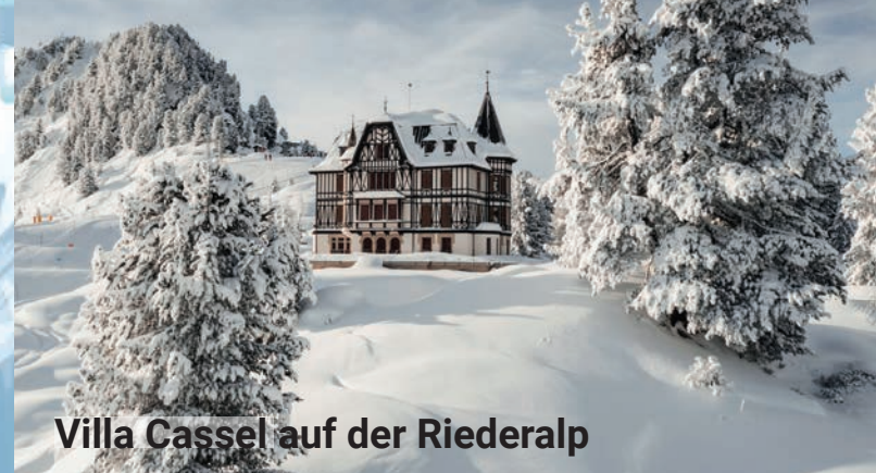
Villa Cassel auf der Riederalp