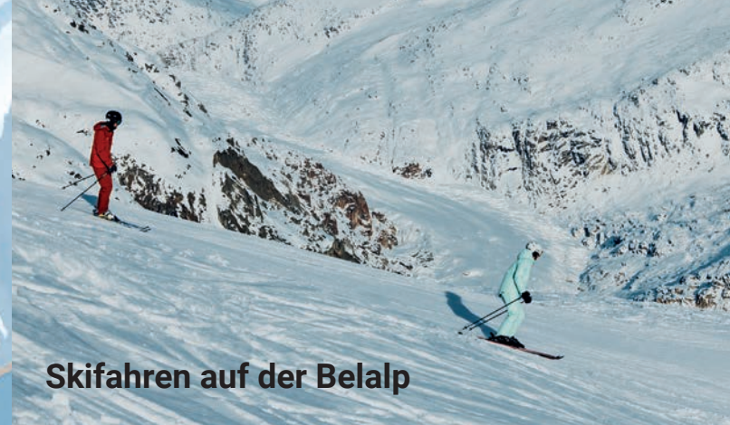
Skifahren auf der Belalp