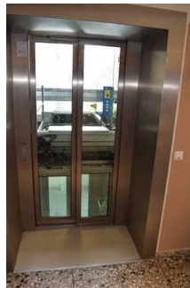
Aufzug zum Garten