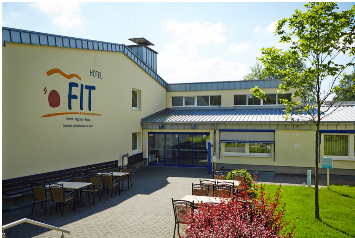
Hotel FIT