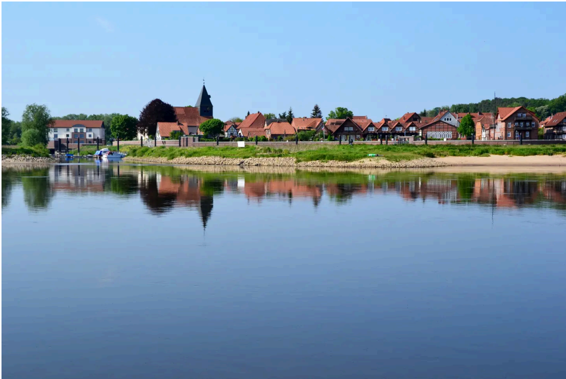
Wendland-Perle: Hitzacker liegt idyllisch an der Elbe gelegen

Das Wendland im östlichen Niedersachsen war lange Zeit sogenanntes „Zonenrandgebiet“ und markierte die innerdeutsche Grenze zur DDR. Nach der Wiedervereinigung blühte das Wendland (Landkreis Lüchow-Dannenberg) immer mehr auf und wurde auch für den Tourismus attraktiver. Vor allem die Region rund um die Elbe gilt es sehr sehenswert. Der kleine, aber feine 13 Kilometer lange Rundweg „ Weidelandschaft Sudeniederung “ startet in dem kleinen Ort Storkenkate und zieht sich durch einen Auwald zum Krainke-Fluss entlang bis nach Preten. Auf der Strecke, die besonders flach ist (nur 20 Höhenmeter) kann man unter anderem Konik-Pferde und Auerochsen bestaunen. Laufzeit: 4 Stunden.