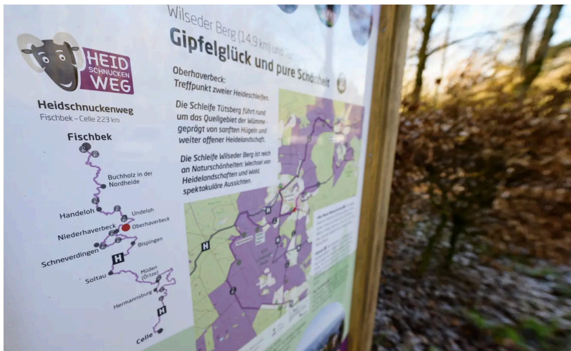
Der Heidschnuckenweg durch die Lüneburger Heide ist 223 Kilometer lang.

Bei Wanderern deutschlandweit sehr beliebt ist der Heidschnuckenweg durch die Lüneburger Heide (zwischen Hamburg und Celle). Der komplette Weg von 223 Kilometern führt über insgesamt zwölf Tagesetappen. Zwischen Anfang August und Mitte September ist es hier besonders schön, wenn die Heideblüte