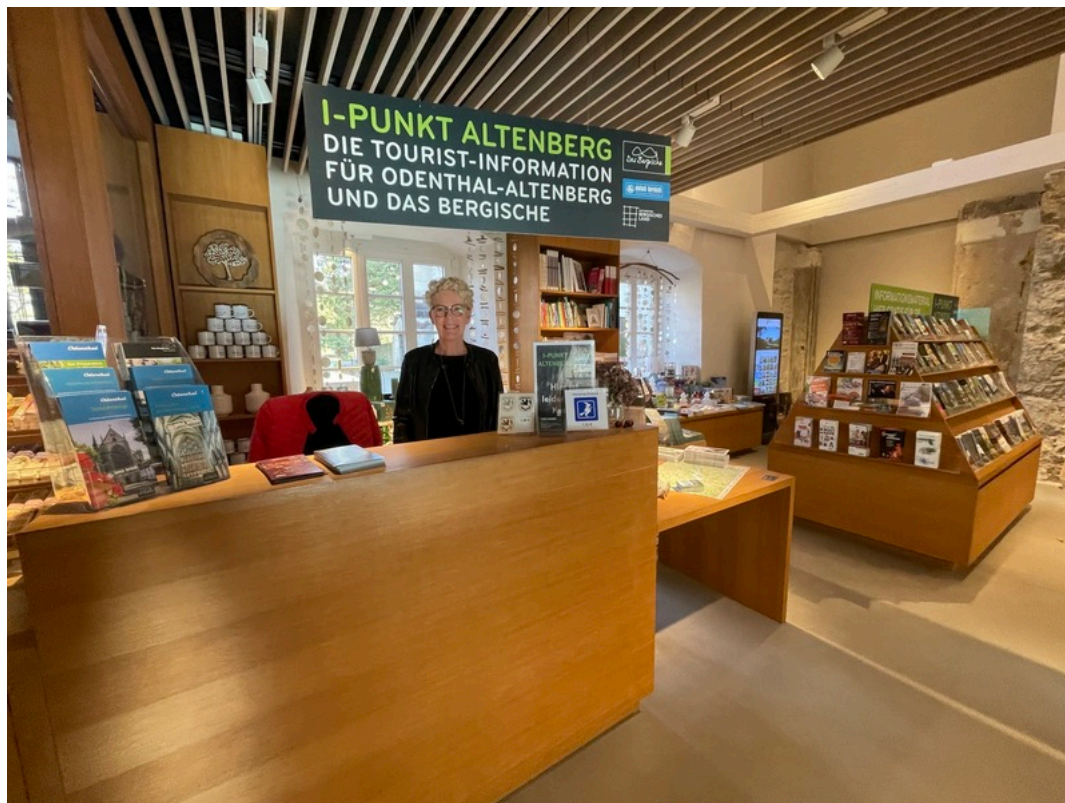
Touristinformation i-Punkt Altenberg