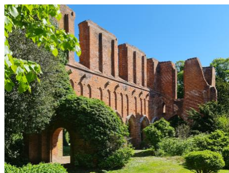
Blick auf die südliche Mittelschiffswand der Klostersruine Hude

Eine Gruppe verlässt den Saal für ca. 30 Minuten. Jedes Kind bekommt ein Klemmbrett mit Stift und einer ausgedruckten Rallye für den Außenbereich. Die gestellten Aufgaben werden einzeln oder in kleinen Gruppen bearbeitet.