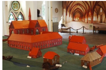
Modell der Klosteranlage Hude um 1300

Kleinere Gruppen können nach der Begrüßung eine mündliche Einführung am Modell der Klosteranlage um 1300 erhalten, werden dann gemeinsam durch das Ruinengelände geführt und dürfen anschließend im Saal eine oder mehrere der gestellten Arbeitsaufgaben aus dem Alltag der Mönche wählen.