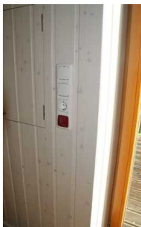
Schlaf-, Wohnraum Notfallalarm an der Eingangstür