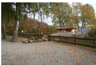
Parkplatz am Baumhaus Ahornhöhe