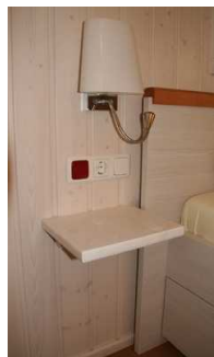
Schlaf-, Wohnraum Notfallalarm am Bett