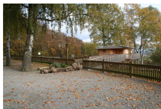
Zugang zum Baumhaus