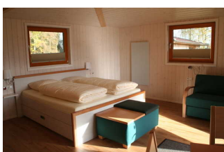
Schlaf-, Wohnraum Baumhaus Ahornhöhe (Blick auf Bett und Sofa)