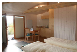
Schlaf-, Wohnraum Baumhaus Ahornhöhe (Blick auf Eingangstür)