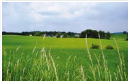
Blick auf Großfastenrath

Die Strecke ist zu Beginn flach, danach überwiegend hügelig. Die Wegbeschaffenheit ist in weiten Teilen geteert oder gepflastert, 2 Abschnitte führen über gut ausgebaute Wald- bzw. Feldwege. Radfahrer aller Altersklassen können auf dieser Strecke die typisch bergische Landschaft rund um Wipperfürth genießen.