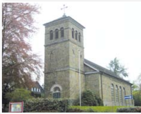
Ev. Kirche Klaswipper

Diese Teiletappe startet geruhsam und eben auf der alten Bahntrasse, die durch das Tal der Wupper, die hier noch Wipper heißt, führt. Hier gibt es in regelmäßigen Abständen schöne Rastmöglichkeiten, man kann die Vogelbeobachtungsstation besuchen und sich an 2 Stationen des Milchweges über die Milchwirtschaft im Bergischen Land informieren. Wer möchte, macht in Klaswipper einen kleinen Abstecher zur evangelischen Kirche. In Ohl bietet sich ein Abstecher zum Pulvermuseum in der Villa Ohl an. Hinter Ohl geht es dann bergauf: Nach einer mittelschweren, ca. 600 m langen Steigung genießt man jedoch