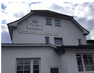
Cordes Akzent Hotel & Restaurant