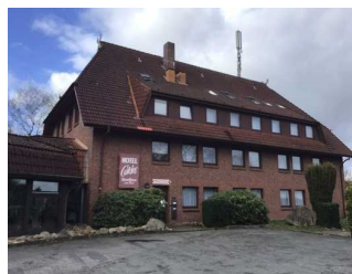
Cordes Akzent Hotel & Restaurant