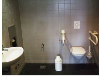
gekennzeichnetes WC Restaurant