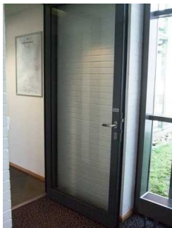
Glastür auf dem Weg zu Zimmer 404

Die Tür ist keine Karussell- oder Rotationstür.