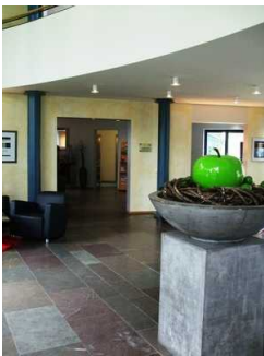
Weg von der Rezeption zum Fahrstuhl