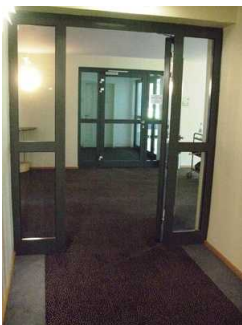
Weg Zimmer 404 zum Wellnessbereich