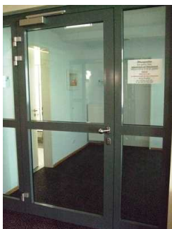
Glastür zum Wellnessbereich