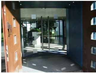
Glastüren innen Haupteingang