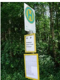
Bushaltestelle beim Hotel