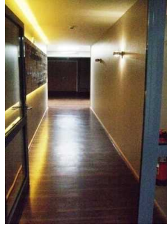
Weg zum Böhmesaal