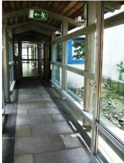
Gang mit 2 gleichen Türen

Die Tür ist keine Karussell- oder Rotationstür.