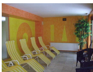
Ruheraum im Saunabereich