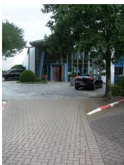
Weg von den gekennzeichneten Parkplätzen zum Eingang