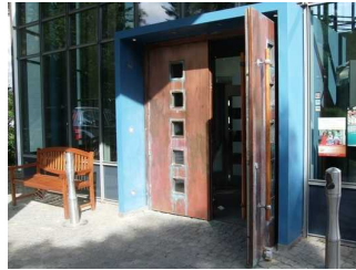
Tür Haupteingang Hotel