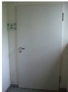
Tür gekennzeichnetes WC im EG