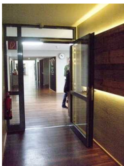
Tür auf dem Weg zum Böhmesaal

Die Tür ist keine Karussell- oder Rotationstür.