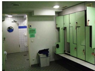
Umkleide Damen im Wellnessbereich