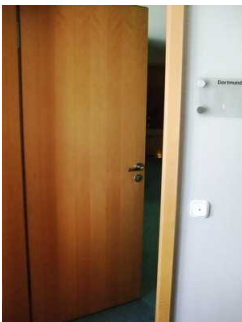
Tür Tagungsraum Dortmund