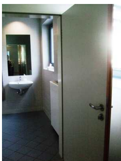
Tür gekennzeichnetes WC im EG