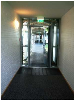
Weg/Flur zu Zimmer 404 im EG