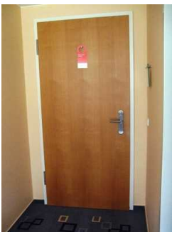
Tür zu Zimmer 404 im EG