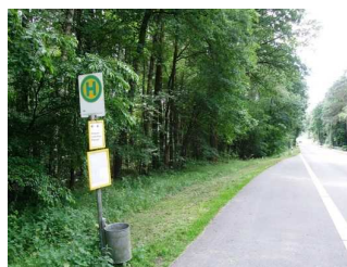
Bushaltestelle beim Hotel