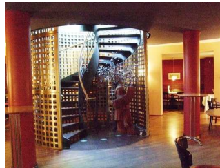
Blick zur Treppe, die in die Bar führt vom EG