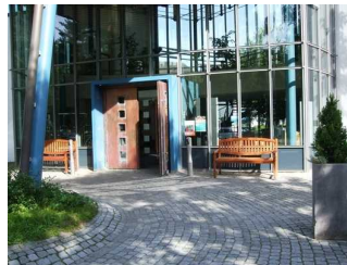
Sitzgelegenheit am Eingang