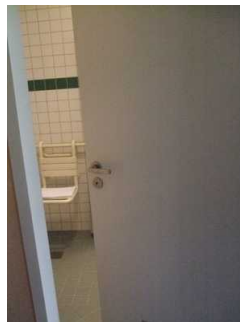
Tür zu Bad Zimmer 404