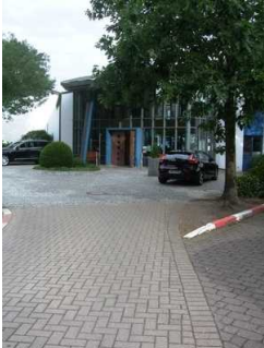
gekennzeichnete Parkplätze Haupteingang