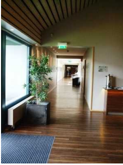
Weg zum Böhmesaal