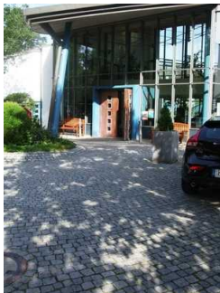
Weg vor dem Hoteleingang