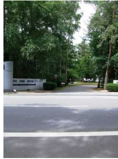
Weg Bushaltestelle Hoteleingang