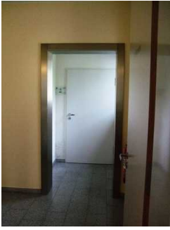
Weg zum gekennzeichneten WC im EG