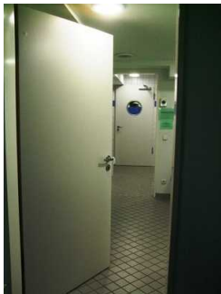
Tür zur Umkleide Damen im Wellnessbereich