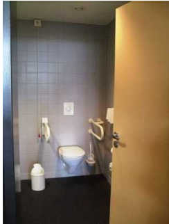
Tür gekennzeichnetes WC Restaurant