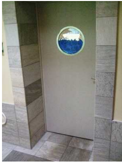
Tür zum Schwimmbad

Die Tür ist keine Karussell- oder Rotationstür.