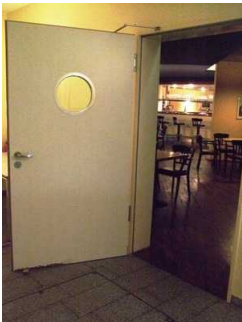
Tür zur Bar im UG