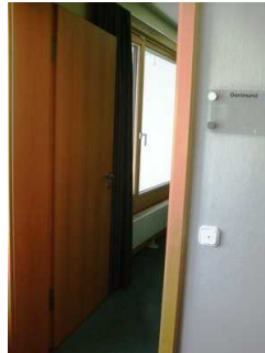
Tür Tagungsraum Dortmund