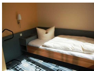
Zimmer 404 im Hotel Park Soltau