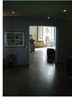
Weg Rezeption zum gekennzeichneten WC im EG