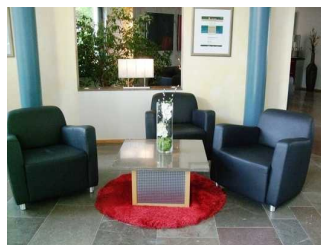
Sitzgelegenheit bei der Rezeption

Bewegungsfläche vor dem Schalter/Tresen/der Kasse - Breite: 500 cm.