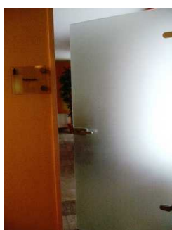
Glastür zum Ruheraum im Saunabereich