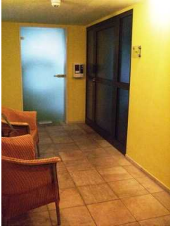
kleiner Flur vor dem Saunabereich