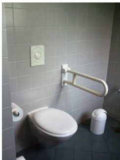
gekennzeichnetes WC im EG