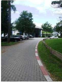
Weg Bushaltestelle Hoteleingang