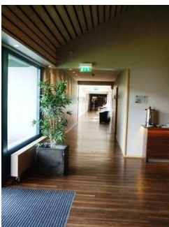
Weg Zimmer404 zum Tagungsraum Do