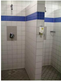
Dusche in der Umkleide Damen im Wellnessbereich