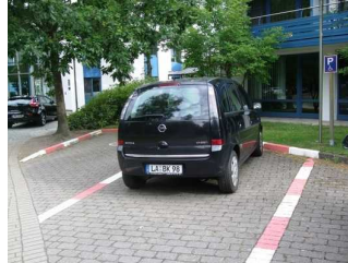
2 gekennzeichnete Parkplätze Haupteingang