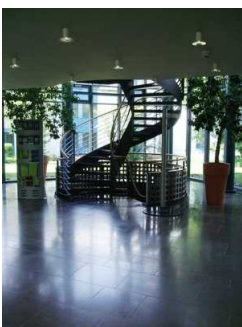
Weg Rezeption zur Wendeltreppe