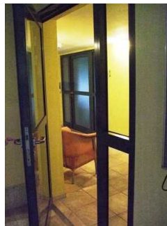
Glastür zum Saunabereich

Die Tür ist keine Karussell- oder Rotationstür.