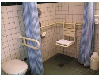
Bad Zimmer 404