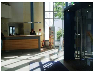
Weg vom Hoteleingang zur Rezeption