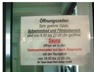
Schild an der Tür zum Wellnessbereich

Die Tür ist keine Karussell- oder Rotationstür.