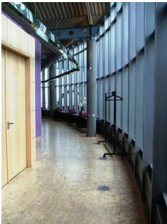
Weg zum Restaurant