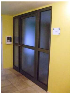
Glastür zum Saunabereich