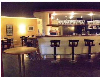
Bar mit Tresenbereich