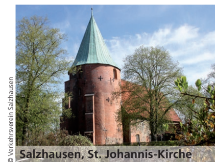
Salzhausen, St. Johannis-Kirche