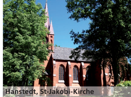
Hanstedt, St. Jakobi-Kirche