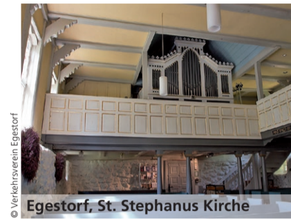
Egestorf, St. Stephanus Kirche