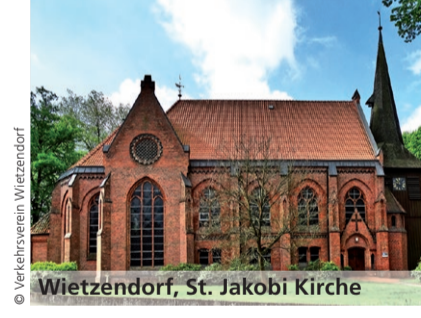
Wietzendorf, St. Jakobi Kirche