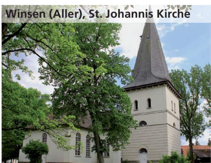
Winsen (Aller), St. Johannes Kirche