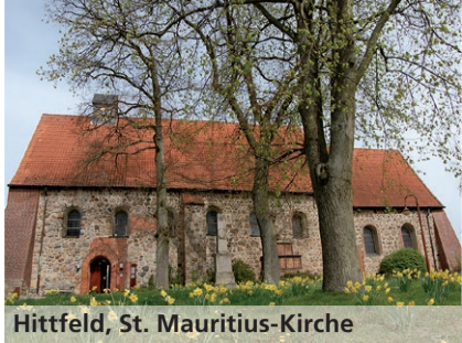
Hittfeld, St. Mauritius-Kirche