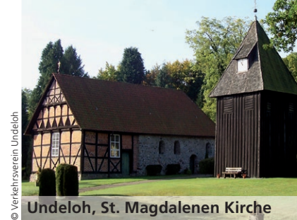
Undeloh, St. Magdalenen Kirche