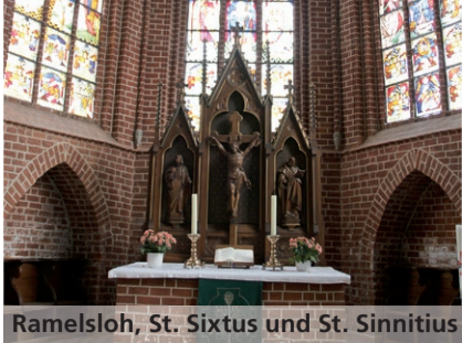
Ramelsloh, St. Sixtus und St. Sinitius