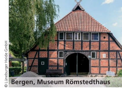
Bergen, Museum Römstedthaus