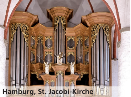
Hamburg, St. Jacobi-Kirche