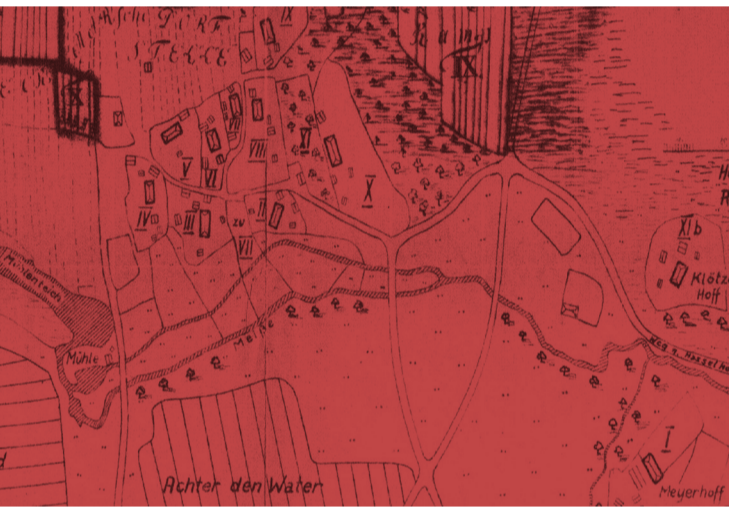
ABB. 1 → Diese historische Karte Bleckmars zeigt die Lage des Meyer Hof (Meyerthoff)