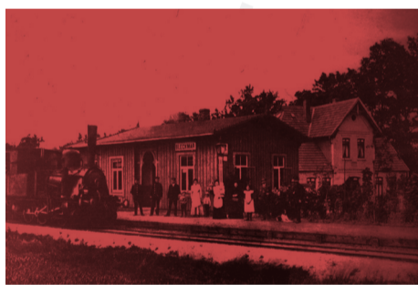
← ABB. 3 Alter Bahnhof in Bleckmar, ca. 1910