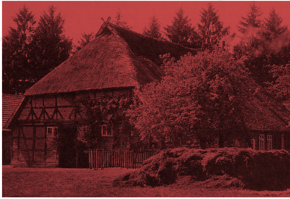
ABB. 2 → Der Klötzenhof. Älteste Urkunde Bleckmars nimmt auf ihn Bezug.

Bleckmar blickt mit Stolz auf eine vielfältige Geschichte zurück. In dem ältesten Dorf der Stadt Bergen und des Landkreises Celle waren die Höfe oftmals im Besitz adliger Herren und Herzöge, so z.B. die Billunger und Welfen. Die umliegende Siedlungsgeschichte reicht weit zurück bis in die Jungsteinzeit, was alte Grabanlagen wie die »Sieben Steinhäuser« am Rande des Truppenübungsplatzes bezeugen. Bleckmar selbst wird erstmals im Jahr 866 unter dem Namen Blecmeri erwähnt.