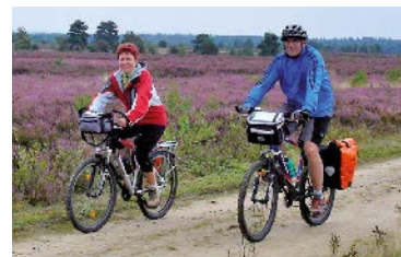
Radeln auf sandigen Abschnitten in der Heide

Bremer Touristik-Zentrale GmbH Findorffstraße 105 28215 Bremen Tel.: 04 21 / 30 80 01 0 btz@bremen-tourismus.de www.bremen-tourismus.de