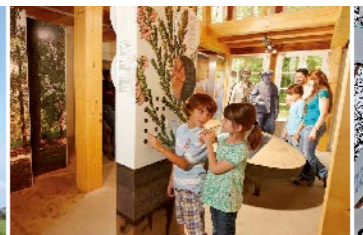
Eintauchen im Heide-ErlebnisZentrum in Undeloh