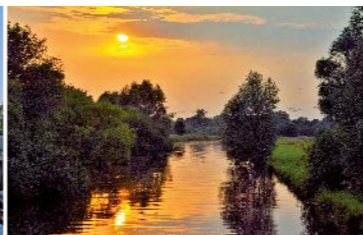
Sonnenuntergang an der Wümme bei Borgfeld