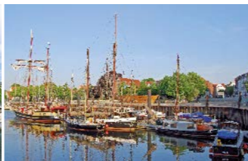
Entdecken des Vegesacker Museumshavens