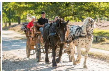
Kutschfahrt zwischen Undeloh und Wilsede