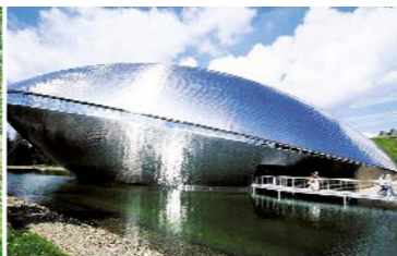
Ein Abstecher zum Bremer Universum