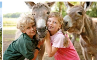
Tierisches Vergnügen im LandPark Lauenbrück