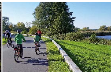
Traumhafter Wegabschnitt im Blockland