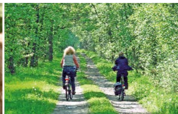
Entspannte Tour durch sattes Grün