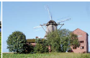
Imposant - die Windmühle in Kampen