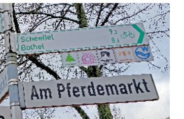
Hier geht's lang