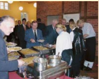
Ein Catering-Service bedient die Gäste am Buffet, denn die Bewirtung wird immer von der ortseigenen Gastronomie übernommen.