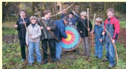
Seminare zur experimentellen Archäologie erfreuen sich auf Burg Bodenteich besonderer Beliebtheit.

Ob Kurse für Entspannungstechniken, Erlebnis- und museumspädagogische Programme mit dem Büro für angewandte Archäologie, AGIL, oder Workshops aller Art. Wir informieren gerne über die kostengünstige Nutzung des gut ausgestatteten Brauhauses.