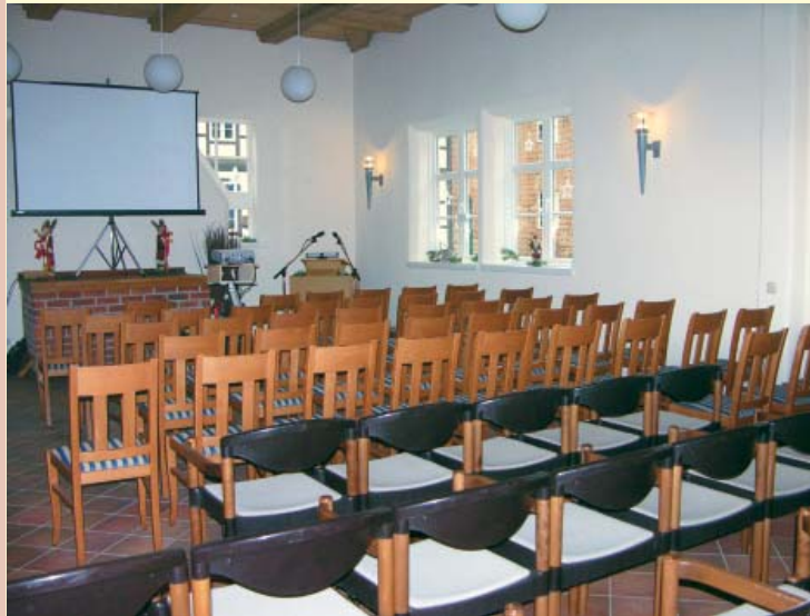
Moderne Konferenztechnik ermöglicht Seminare und Konferenzen wie hier in der „Malzdiele“

Mit insgesamt rund 520 qm Nutzfläche bietet das Brauhaus verschiedene große Räumlichkeiten als Tagungs- oder Seminarhaus. Malz- und Braudiele sowie der Kornboden stehen für Veranstaltungen dieser Art zur Verfügung.