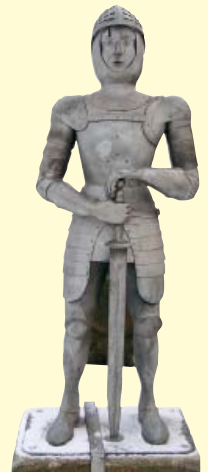
Ein Ritter begrüßt die Gäste.

Das Areal umfasst heute neben dem Hauptgebäude mit Rittersaal und Burgmuseum, das Brau- und Backhaus sowie den Burgturm mit einer interessanten Ausstellung zur Waffen- und Wehrtechnik im Mittelalter. Des Weiteren befinden sich ein Rosen- und Bierkräutergarten, der Vierhundert-Wasser-Barfußpfad und das "Robin-Hood-Castell", ein mittelalterlicher Spielplatz für "Groß und Klein", im direkten Umfeld der Burganlage.