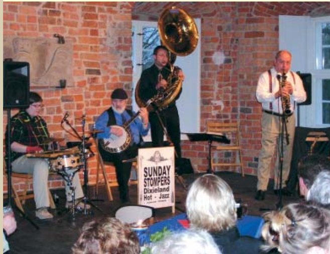
Jazzfrühschoppen im Rittersaal