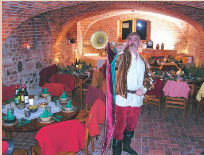
Der Gewölbekeller bietet einen idealen Rahmen für mittelalterliche Bankette.

Nach der offiziellen Einweihung des wieder errichteten Brauhauses im Dezember 2005 präsentiert sich das Gebäudeensemble der Burg Bodenteich wieder geschlossen. 284 Jahre, von 1634 bis 1918 wurde in der so genannten Amtsbrauerei obergäriges Bier, der so genannte “Knorrbock” gebraut.