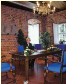
Traumzimmer in der Burg