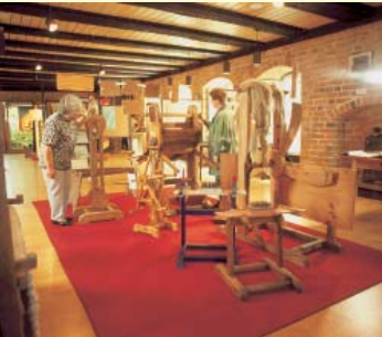
Das Burgmuseum im Hauptgebäude der Burg ist mehr als ein Heimatmuseum.