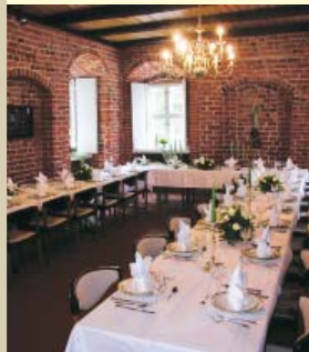
Im Rittersaal der Burg kann man heiraten und dort, oder auch im Brauhaus, das besondere Ereignis festlich feiern!

Der Rittersaal im Hauptgebäude steht ebenso wie das Brauhaus nach Absprache auch für private Feierlichkeiten und Veranstaltungen zur Verfügung, etwa für ein festliches Bankett.