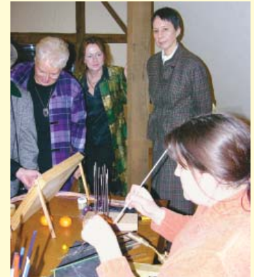
Erlebnisseminare werden zu den unterschiedlichsten Themen angeboten.

Der Kornboden im Obergeschoss des Brauhauses bietet ideale Voraussetzungen für Tagungen, Seminare und Ausstellungen. Die erste Etage des Brauhauses ist mit einem Fahrstuhl erreichbar und bietet somit auch behinderten Teilnehmern und Besuchern leichte Erreichbarkeit.