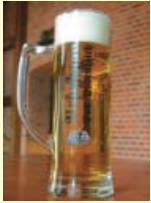
Der Bodenteicher „Knorrbock“.