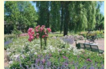
„Lustwandeln“ im Rosengarten.

Dies alles können Besucher selbst erfahren oder in betreuter Form als entsprechende Tages- und Erlebnisprogramme buchen.