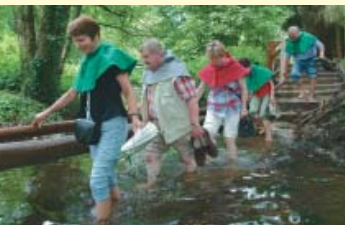
Der Vierhundert-Wasser-Barfußpfad führt zum Robin-Hood-Castell.