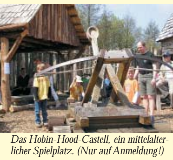
Das Hobin-Hood-Castell, ein mittelalterlicher Spielplatz. (Nur auf Anmeldung!)