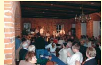
Nicht immer fasst der Rittersaal alle konzertinteressierten Besucher.

Eine besondere Atmosphäre vermittelt der Rittersaal, wenn er als Trauzimmer umgestaltet und für die standesamtliche Hochzeit hergerichtet ist. Ein attraktiver Rahmen für einen der schönsten Momente im Leben!