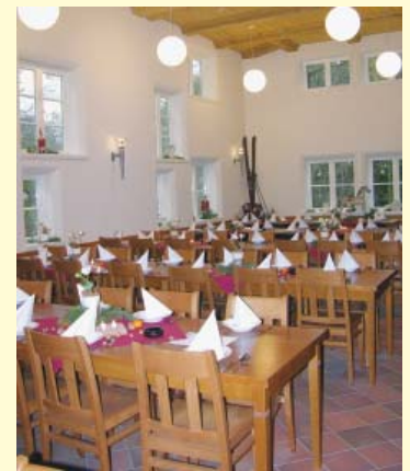
Die Braudiele in Kombination mit der Malzdiele im Erdgeschoss des Brauhauses bietet Gesellschaften einen stilvollen Rahmen.

Die Bewirtung der Räumlichkeit ist ausschließlich in Verbindung mit der örtlichen Gastronomie möglich.