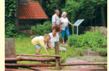
Der Bierkräutergarten auf der Burg

Selbstverständlich stehen die genannten Außenanlagen in Verbindung mit der Nutzung der Räumlichkeiten der Burg je nach entsprechenden Bedürfnissen und auf Anfrage auch für private Veranstaltungen exklusiv zur Verfügung. Bitte bringen Sie Verständnis dafür auf, dass dies nur nach rechtzeitiger Terminabsprache möglich ist, da bereits eine Vielzahl von Veranstaltungen auf dem Gelände regelmäßig durchgeführt wird.