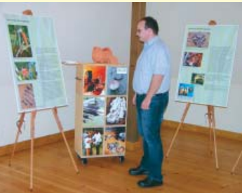
Der „Kornboden“ im Obergeschoss eignet sich für Ausstellungen.