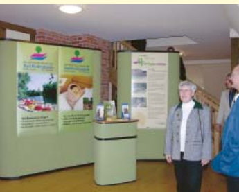
Präsentationen und Tagungen jeder Art.

Mit insgesamt rund 520 qm Nutzfläche bietet das Brauhaus verschiedene große Räumlichkeiten als Tagungs- oder Seminarhaus. Malz- und Braudiele sowie der Kornboden stehen für Veranstaltungen dieser Art zur Verfügung.