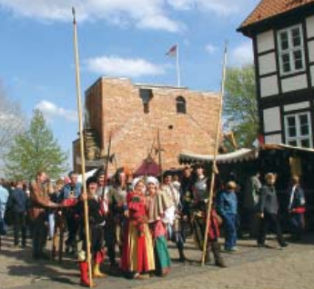
Burgturm und Hauptgebäude bilden die Kulisse auch für mittelalterliche Spektakel.

Die ehemalige Wasserburg Bodenteich, eine mittelalterliche Befestigungsanlage, war ursprünglich der Wohnsitz der Familie "von Bodendike". In den letzten Jahren hat sich die Burg zu einem beliebten Geschichts- und Erlebnisgelände entwickelt.