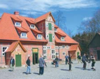
Das Brauhaus mit dem Burgplatz bietet vielseitige Nutzungsmöglichkeiten.

Tagungen, Seminare & Ausstellungen in entspannter Atmosphäre!