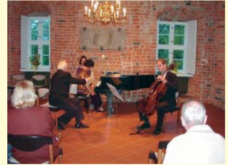
Klassische Konzerte finden im Rittersaal einen besonders stilvollen Rahmen.

Dem besonderen Flair der Burg Bodenteich, insbesondere dem des Rittersaales, sind nicht nur die Bodenteicher erlegen, auch Besucher und Gäste kehren immer wieder gerne hierher zurück.