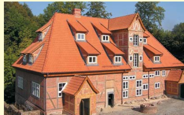
Erst durch das wieder errichtete Brauhaus mit Malzdiele, Braudiele, Braukeller und Kornboden ist das Gebäudeensemble wieder geschlossen.

Maßgeschneiderte Angebote unter www.bad-bodenteich.de