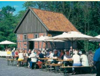
Der verführerische Duft von frischem Brot lockt die Gäste zum Backhaus.