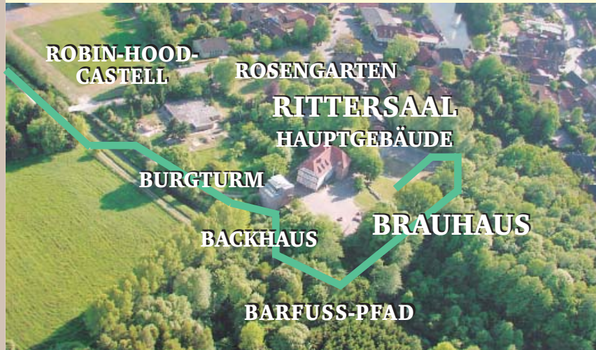
Übersicht des Burggeländes mit seinen Einrichtungen.