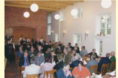
Die Braudiele im Brauhaus-Erdgeschoss gilt vielen als idealer Ort für Feierlichkeiten jeder Art.

Heute stehen im Brauhaus Räumlichkeiten wie Braukeller, Malz- und Braudiele als auch ein “Kornboden” für Gesellschaften, Tagungen, Seminare, Ausstellungen und Events für Firmen und Privatfeiern zur Verfügung. Eine Örtlichkeit nahe dem Ortskern, fußläufig gut zu erreichen und mit ausreichend kostenfreier Parkfläche ausgestattet. Das mittelalterliche Flair bildet den einzigartigen Hintergrund für Veranstaltungen und stimmungsvolle Festlichkeiten.