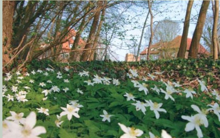
Das Burggelände, inmitten herrlicher Natur!

Geschichte und Gesundheit in einem herrlich natürlichen Umfeld: Hierfür steht die Burg Bodenteich. Die „Seewiesen“ und das Wäldchen „Knick“ mit dem „Vierhundert-Wasser-Barfußpfad“ sind als Zeitreise durch die Geschichte des Gesundheitswesens gestaltet und für jedermann unentgeltlich zu begehen. „Streuobstwiese“, Bierkräutergarten und der Rosengarten am Fuße der Burg verzaubern die Sinne und laden zum Entspannen und Lustwandeln ein.