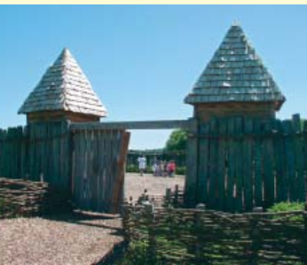
Das „Robin-Hood-Castell“, ein Mittel- alterspielplatz für alle Generationen. (Benutzung nur auf Anmeldung)

Geschichte und Gesundheit in einem herrlich natürlichen Umfeld: Hierfür steht die Burg Bodenteich. Die „Seewiesen“ und das Wäldchen „Knick“ mit dem „Vierhundert-Wasser-Barfußpfad“ sind als Zeitreise durch die Geschichte des Gesundheitswesens gestaltet und für jedermann unentgeltlich zu begehen. „Streuobstwiese“, Bierkräutergarten und der Rosengarten am Fuße der Burg verzaubern die Sinne und laden zum Entspannen und Lustwandeln ein.