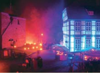
Burgillumination anlässlich des alljährlichen Mittelalterspektakels.