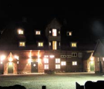
Ein einmaliges Ambiente auch am Abend.