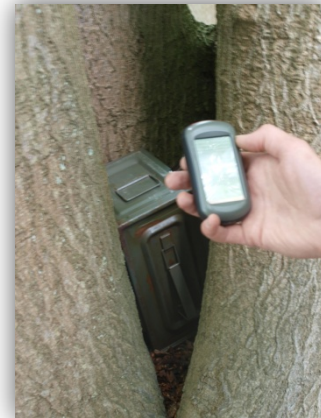
Hier seht Ihr die Schatzkiste, aber nicht das Versteck, das Ihr suchen müsst!

Der Schatz ist in einer grünen Metallkiste (ca. 15 x 20 x 30 cm) verborgen. Wenn Ihr diese gefunden habt, werdet Ihr feststellen, dass sie verschlossen ist. Öffnen könnt ihr sie erst, wenn Ihr alle bisherigen Rätsel richtig gelöst habt. Tragt dazu die Ergebnisse der Stationen 1 bis 8 in die unten stehenden Gleichungen ein. Das Ergebnis öffnet Euch die Schatzkiste.