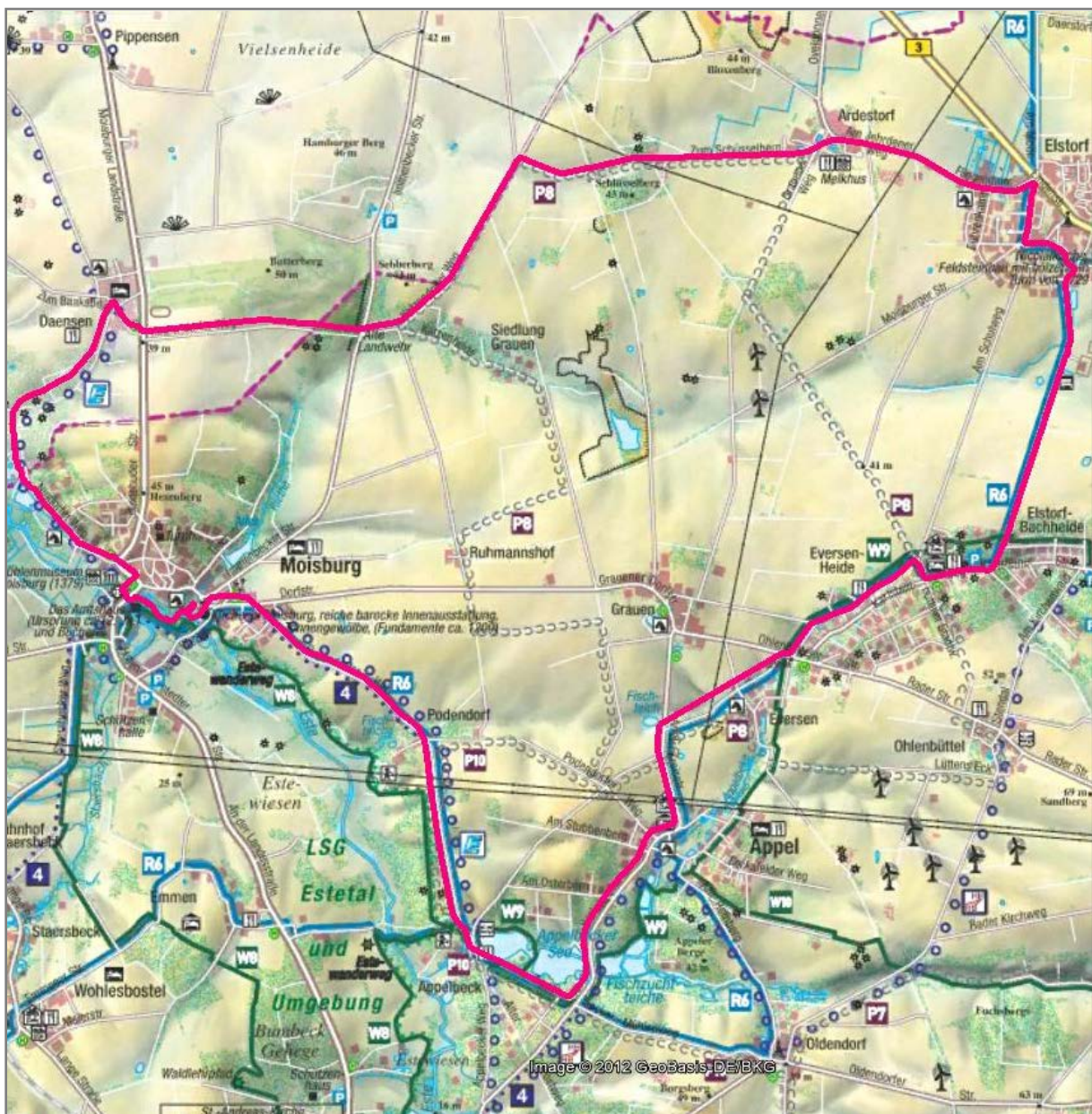
(Karte: Studio für Landkartentechnik, www.maiwald-karten.de )