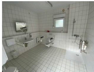
WC, Dusche, Waschraum