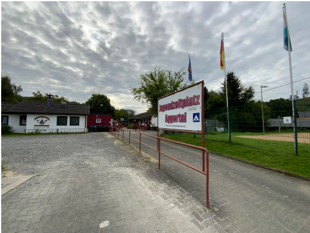
Jugendzeltplatz Aggertalsperre