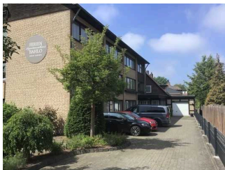
Ferien- Appartementhaus Bahlo