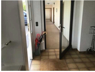
Weg zur Rezeption / Zimmer