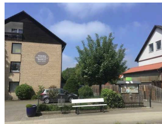
Ferien- Appartementhaus Bahlo