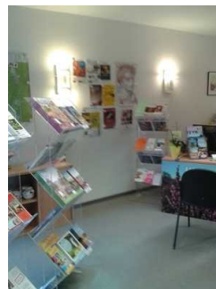
Blick in den Beratungsraum mit Counter und Prospektständern

Anmerkungen für den Gast: Ausreichend Platz vor den Prospektständern.