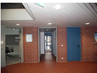
Im 1. Stock Blick aus dem Aufzug auf Flur zum WC