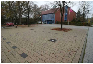
Behinderten Parkplatz vor dem Rathaus