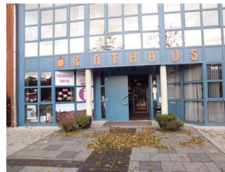
Blick auf das Rathaus