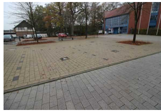
2 Behinderten Parkplätze vor dem Rathaus

Es ist ein allgemeiner Parkplatz vorhanden.