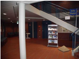
Blick auf die WC- Tür