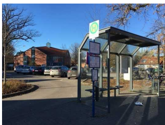
Bushaltestelle am Marktplatz

Entfernung der Haltestelle für Menschen mit Behinderung zum Eingangsbereich: 64 m.