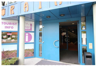
Eingang ins Rathaus und zur Tourist Information