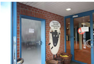
Windfang gleich hinter der Eingangstür ins Rathaus. Die Tür in die Tourist Information geht von dort ab.