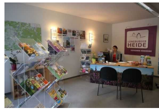
Counter mit Sitzplätzen und mobilen Prospektständern

Der Schalter/Tresen/die Kasse ist von der Eingangstür aus direkt sichtbar.