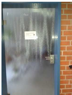
Glastür in den Beratungsraum