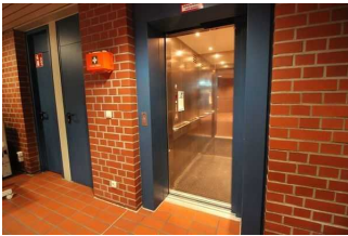
Tür im Erdgeschoß in den Aufzug

Die Bedienelemente bzw. die Beschilderung sind weder bildhaft noch (im Falle eines entsprechenden Leitsystems) farblich gekennzeichnet.