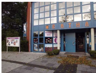
Rathausvorplatz mit Info Tafel

Name und Logo des Betriebes/der Einrichtung sind von außen klar erkennbar.