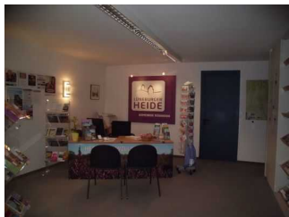
Counter in der Tourist Information, die Tür im Hintergrund ist nicht für Gäste zu benutzen.