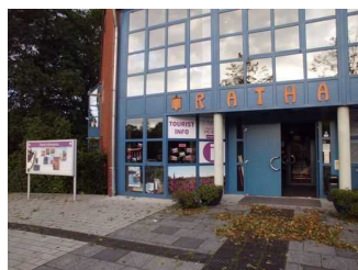
Tourist Information der Gemeinde Südheide im Rathaus