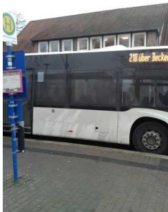
Fahrplan an der Bushaltestelle und Busbeschriftung