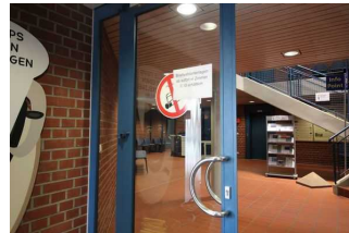
Vom Windfang durch die Tür zum Rathaus, um zum WC zu gelangen.