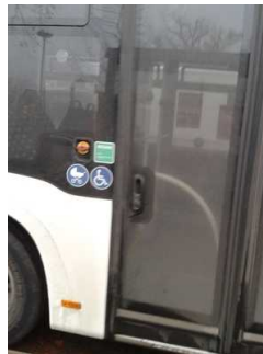
Einstieg in den Bus