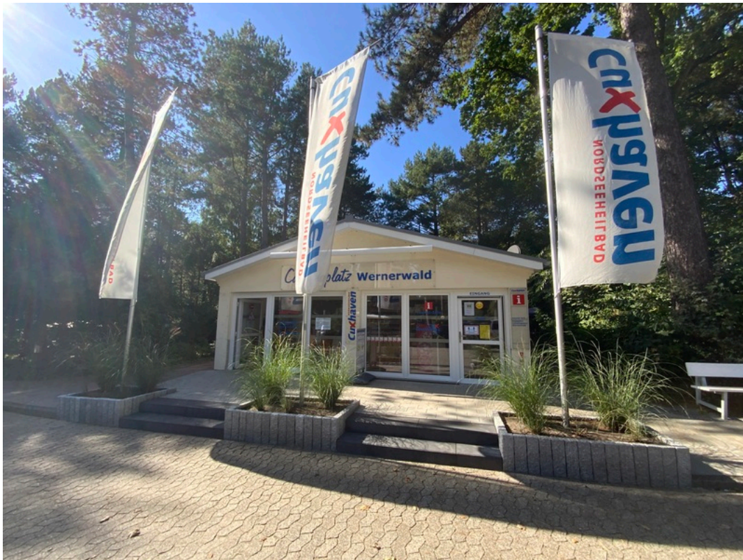
Tourist-Information Sahlenburg