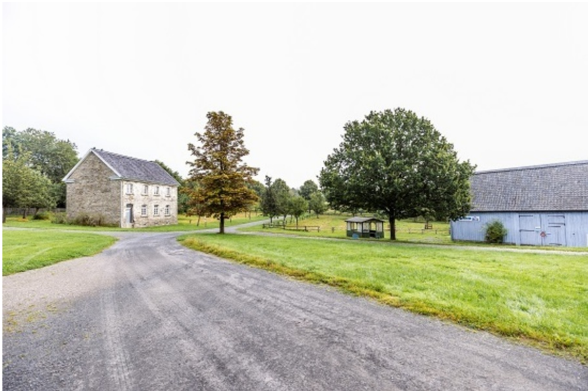
LVR-Freilichtmuseum Lindlar | Fotoagentur Wolf