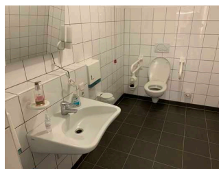
Öffentliches WC Eingangsbereich