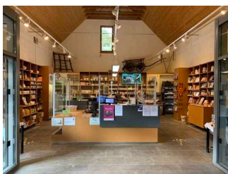
Kasse / Ticketschalter