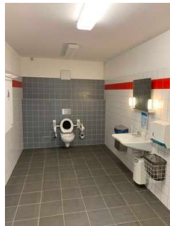
Öffentliches WC an der Zehntscheune