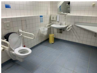
Öffentliches WC an der Schmiede