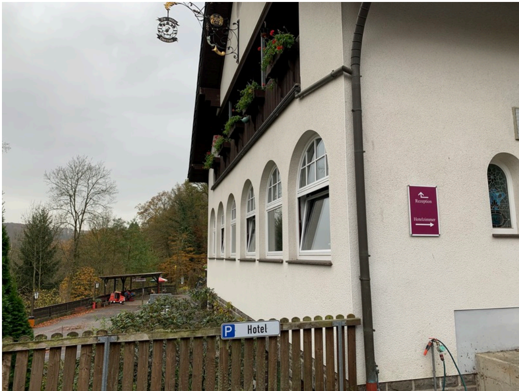
Märchenwald Altenberg Hotel