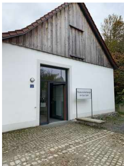
Museumsherberge LVR–Freilichtmuseum Lindlar