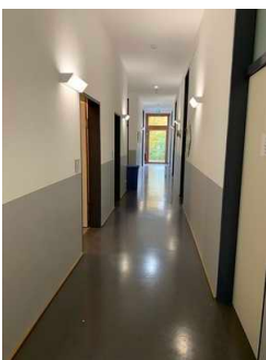
Flur/ Wege in der Herberge